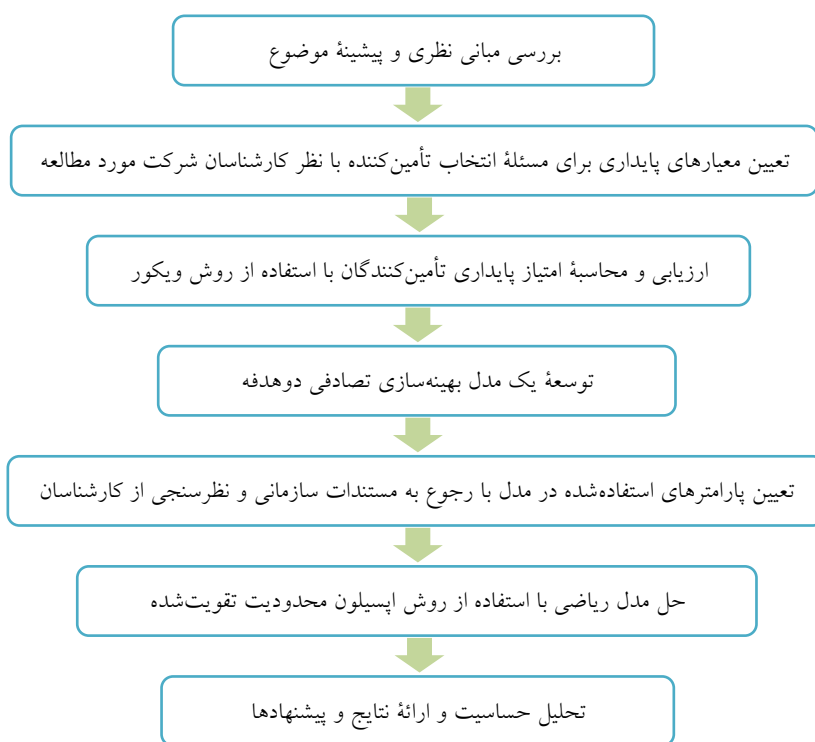
شکل ۱- مراحل پژوهش

در رابطه مذکور، پارامتر ph نشان‌دهنده احتمال وقوع رویداد اختلال برای تأمین‌کننده h است که با توجه به نظر خبرگان و داده‌های تاریخی تعیین می‌شود. مدل ریاضی پیشنهادی در مقایسه با مدل کمال‌احمدی و ملت‌پرست (۲۰۱۶)، چندمحصولی و دوهدفه است و علاوه بر تابع هدف هزینه کل مورد انتظار، تابع هدف جدیدی برای لحاظ کردن مفهوم پایداری در مسئله انتخاب تأمین‌کنندگان و نیز محدودیت‌هایی مانند محدودیت حداقل سفارش به هر تأمین‌کننده و حداکثر نرخ خرابی قطعات تعریف شده است. نرخ خرابی به درصد قطعاتی اشاره دارد که از شرکت تأمین‌کننده به صورت معیوب ارسال می‌شود که این خرابی‌ها ممکن است به علت حوادث حمل‌ونقل، مسائل تکنولوژیکی و خطاهای انسانی رخ دهد. همچنین این پژوهش به کاربرد عملی مدل ارائه شده در شرایط واقعی توجه کرده است. همانگونه که بیان شد، در مدل پیشنهادی، پارامتری برای انعطاف‌پذیری ظرفیت تأمین‌کنندگان در نظر گرفته شده است که به آنها امکان می‌دهد هنگام مواجه شدن سایر تأمین‌کنندگان با ریسک اختلال، نیاز شرکت را با تحویل قطعاتی بیشتر از میزان سفارش تخصیص یافته به آنها برآورده کنند.