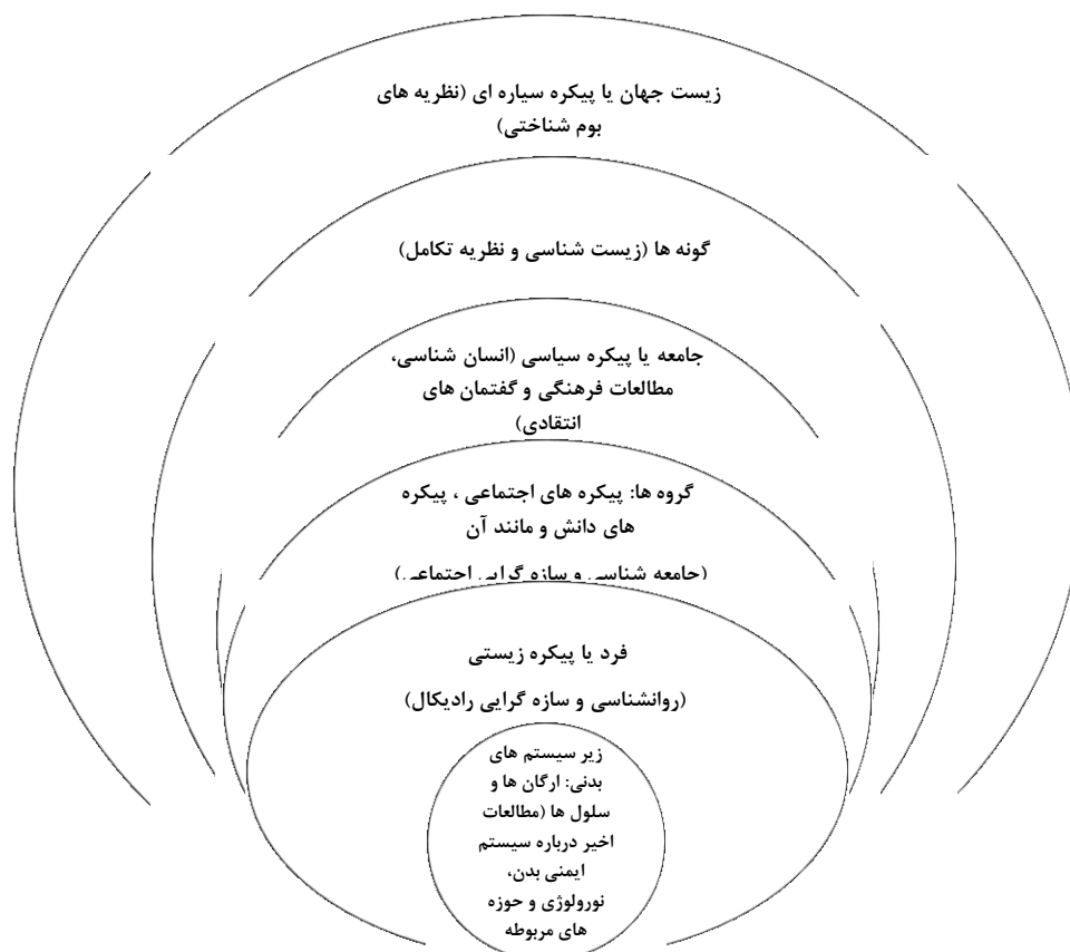
شکل ۲: قلمرو یادگیری در پارادایم پیچیدگی

از نظر دال ۲ ، یادگیرنده واحدی پیچیده است که قادر به سازگار کردن خود با انواع وضعیت‌های جدید و مختلف می‌باشد و مانند یک عامل فعال در مواجهه با جهان پویاست. در دیدگاه‌های سنتی و مدرن، یادگیرنده یک فرد مجزا و منفرد محسوب می‌شود، اما در این دیدگاه، یادگیرندگان علاوه بر افراد