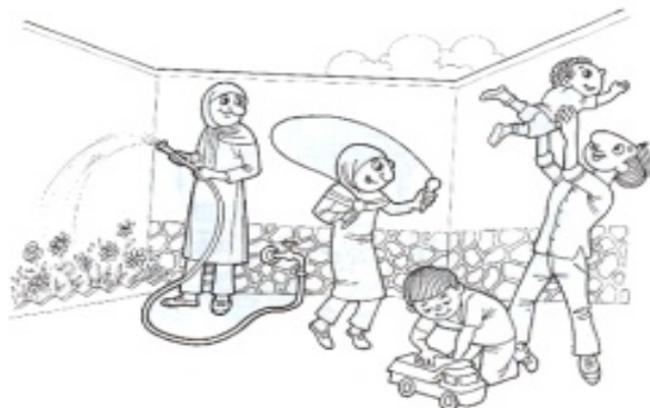
شکل ۱. تصویر تزیینی (برگرفته از کتاب Book 1 ، شماره ۱۳۸۶: ۸)