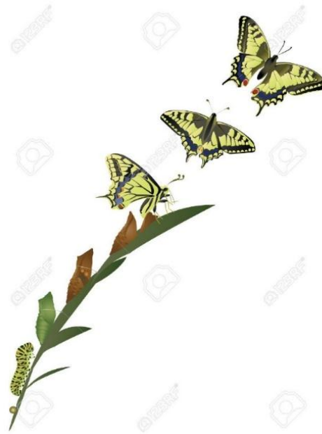
شکل ۱: مراحل تولد پروانه

شکل مراحل تولد پروانه همانند الگوی سلولی - شناختی شکل‌گیری معنی می‌باشد. در هر دو مورد و نیز نمونه مربوط به تولد انسان، یک سلول یا یک واحد (تخم در مورد پروانه، نطفه در مورد انسان و همچنین واژه در مورد زبان) در مرحله آغازین قرار دارد. در مرحله بعدی، واحد/سلول مذکور رشد نموده (تبدیل تخم به کرم و شفیره در مورد پروانه، تبدیل نطفه به گوشت/استخوان در مورد انسان، و کسب اطلاعات بیشتر و نو در مورد واژه در زبان) و در مرحله نهایی سلول به موجود زنده تبدیل می‌شود (کرم پروانه می‌شود، نطفه انسان می‌شود، واژه در بافت/گفتمان معنی می‌شود). همچنین، نباید از بافت هر یک از نمونه‌ها غافل شد. نطفه در رحم مادر، پروانه در محیط زیست خود و واژه در بافت/گفتمان رشد نموده و متولد می‌شوند.