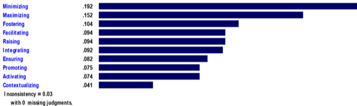
شکل (۲). نمودار وزنی ده عامل اصلی انتخاب پسمتد در مدارس دولتی

Priorities with respect to: Goal: Teachers' Priorities