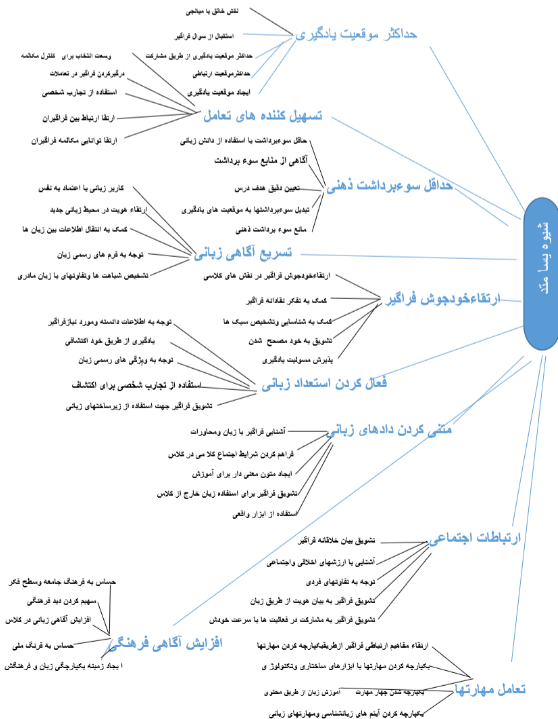
شکل (۱). نمودار درختی سلسله مراتبی AHP عوامل موثر بر پسا مند