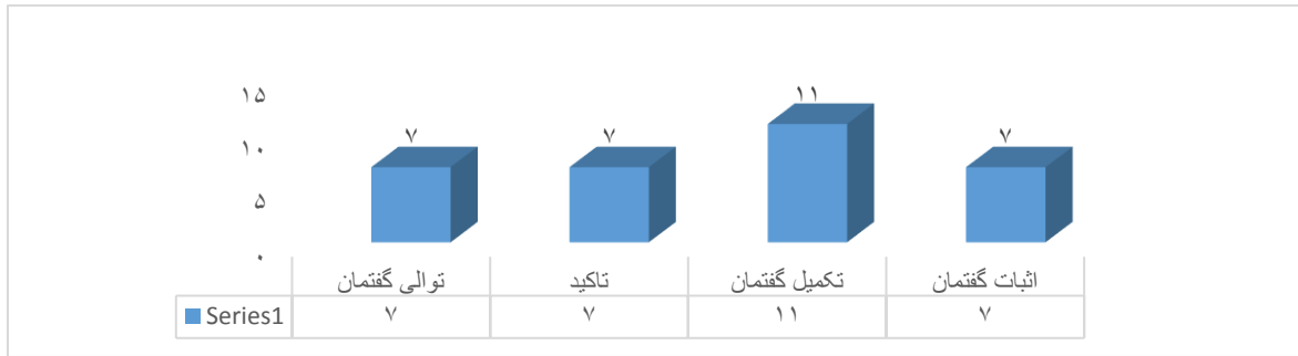
شکل ۳. عدم تغییر گفتمان‌نمای "و"

یعنی ۲۶ درصد ترجمه گفتمان‌نمای "و" هیچ نوع تغییر و حذفی انجام نشده‌است. دلیل آن چیست؟ مطابق شکل ۳ و جدول ۵، تحلیل مثال‌ها و موارد عدم تغییر گفتمان‌نمای "و" نشان می‌دهد که دلایل چهارگانه ذیل باعث عدم تغییر آن شده‌است: اثبات نظر در گفتمان با ۷ نمونه و ۲۲٪ (ردیف‌های ۱ و ۲)، تکمیل محتوای واحد گفتمان با ۱۱ مثال و ۳۴٪ (ردیف‌های ۳ و ۴)، و سرانجام ۷ مورد و ۲۲٪ نیز در حوزه‌های توالی (ردیف ۵) و تاکید (ردیف‌های ۶ و ۷) در گفتمان. استفاده از این راهبردهای گفتمانی در فرایند رمزگذاری داده‌ها در ترجمه مانع حذف یا تغییر گفتمان‌نماها در این حوزه می‌شود.