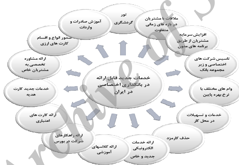
نمودار ۲. خدمات جدید قابل ارائه در بانکداری اختصاصی در ایران

برای پاسخ به آخرین پرسش مطرح شده در این پژوهش که به نوعی با امکان‌سنجی توسعه خدمات بانکداری اختصاصی در کشور مطرح شده است محققین بر آن بودند تا خدمات بالقوه جدیدی را شناسایی نمایند که می‌توان در بانک‌های ایرانی و در قالب طرح بانکداری اختصاصی مطرح نمود، بنابراین در پاسخ به این پرسش موارد مناسبی مطرح شد که برخی از آنها از منظر ادبیات بانکداری اختصاصی جدید بوده و می‌تواند نقطه عطفی در راه توسعه این حوزه باشد. فهرست این خدمات در قالب نمودار (۲) به تصویر کشیده شده است.