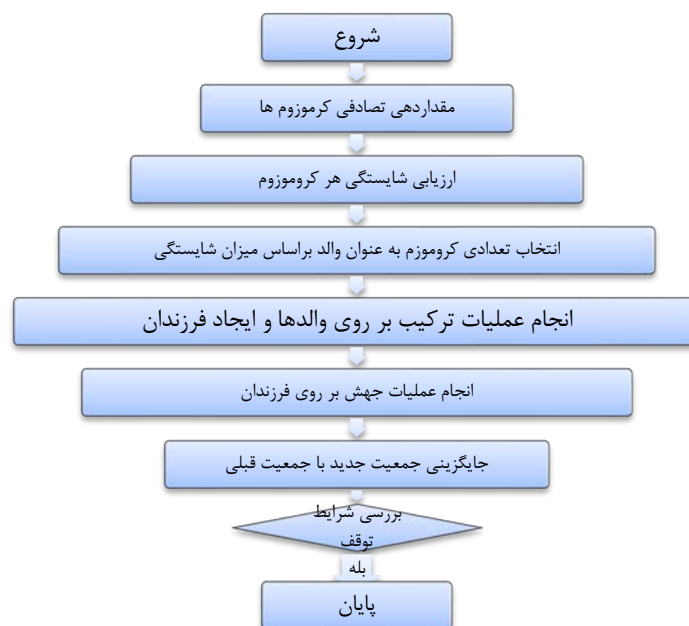
شکل ۲. فلوچارت کلی الگوریتم ژنتیک

در جدول (۲) نتایج الگوریتم ژنتیک طراحی شده برای تعیین مؤثرترین متغیرها با مقادیر احتمال-های مختلف عملگر ترکیب (Pc) و جهش (Pm) آورده شده است: