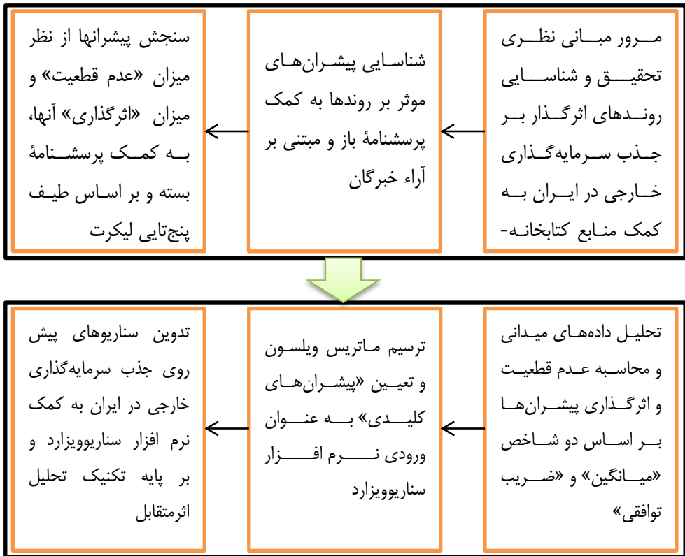
شکل ۱. فرایند کلی تحقیق