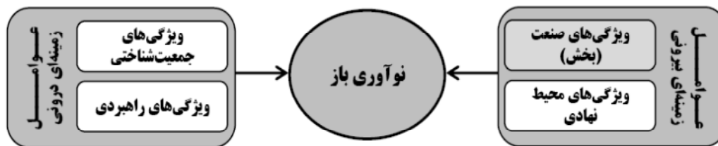
شکل ۱- دسته‌بندی عوامل زمینه‌ای مؤثر بر نوآوری باز [۱۶]

با توجه به رویکرد شرکت‌ها به نوآوری باز، در یک دسته‌بندی کلی، عوامل زمینه‌ای مؤثر بر نوآوری باز را می‌توان به عوامل زمینه‌ای درونی و عوامل زمینه‌ای بیرونی تقسیم نمود. عوامل زمینه‌ای درونی مربوط به ویژگی‌های جمعیت شناختی و ویژگی‌های راهبردی و عوامل زمینه‌ای بیرونی مربوط به ویژگی‌های صنعت و ویژگی‌های محیطی است [۱۶].