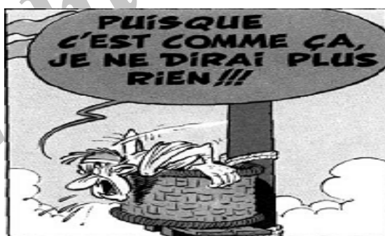
شکل ۱ علائم خشم: چشمان باز و از حدقه‌درآمده، دهان باز

احتمالاً در کارتونها دیده‌اید که سر فرد خشمگین قرمز می‌شود و به اطراف می‌چرخد، انگار فرد خشمگین برای کاهش خشم خود سرش را به این‌ور و آن‌ور می‌چرخاند.