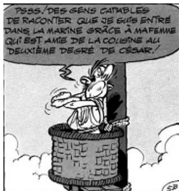
شکل ۲ علائم خشم: دهان محکم بسته‌شده، چشمان بسته، دستان به هم قفل شده و نزدیک بدن