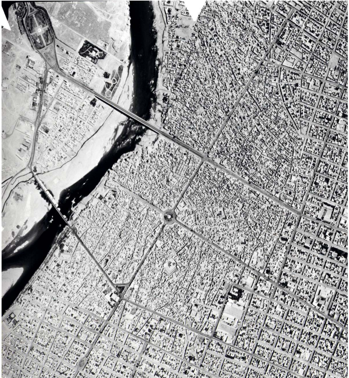
Fig 13.8: An aerial view with serial No.: 75.743 from the city taken in 1351 AH/1972 AD. This shows the situation of the city following the execution of the