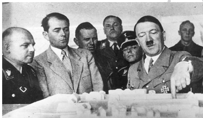
شکل ۵: آدولف هیتلر و اسپیر (دومی از سمت چپ) در حال بررسی ماکتی از یک طرح شهری

در این شکل از مداخله، طبقه حاکمه از حداکثر قدرت خود برای نظارت بر طرح توسعه یک شهر بهره می‌جوید. شخص حاکم بر برنامه‌ریزی‌ها و پیشرفت‌ها نظارت دارد و همواره این مسئله را بررسی می‌کند که آیا این طرح توسعه و رشد در راستای هدف و کیفیت مورد نظر او هست یا نه. در این حالت حکومت نحوه دسترسی و چگونگی امکان استفاده مردم عادی از کلیه قسمت‌های شهر را برنامه‌ریزی و تعیین می‌کند. همچنین این که چه کسانی مالکیت بخش‌های مشخصی از شهر را به دست می‌آورند و چه چیزی به چه شکلی و در کجا ساخته می‌شود، نیز تحت نظارت مستقیم طبقه حاکمه تعیین می‌گردد.