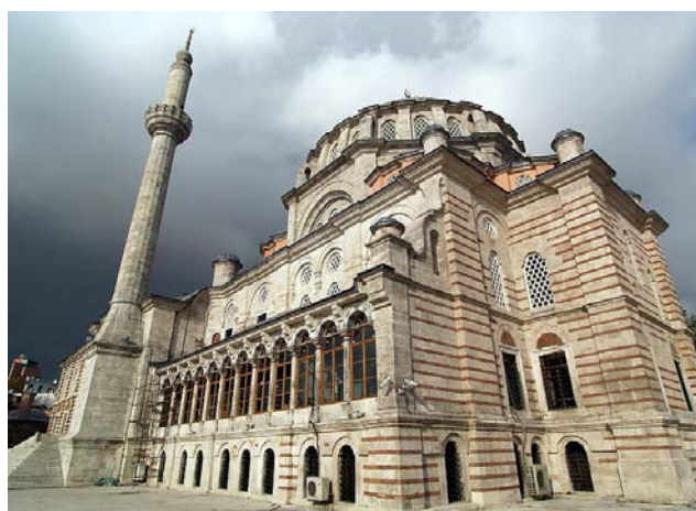
شکل ۲: مسجد لاله علی (Laleli) ۱۷۶۰-۱۷۶۴م. به سبک باروک عثمانی

این شکل از مداخله‌در دو حالت صورت می‌گیرد. اول این که طبقه حاکمه یک یا چند مدل از شهرسازی و یا شکل شهرهای ساخته شده پیشین را به عنوان الگو برای توسعه شهر، ارائه می‌دهد. در حالت دوم، حاکم‌حمایت و پشتیبانی خود را به کار می‌بندد تا فلسفه و یا ایده آلی را در شکل شهر جامعه عمل ببوشاند. به طور مثال در قرن ۱۸ میلادی (۱۱ ه.ش) اولین سفیر ترکیه، محمetchلیبی (Mehmet Celebi)، پس از بازگشت از پاریس، در گزارش مکتوب خود به توضیح دقیق برخی از ابنیه‌شهری پاریس پرداخت (Celik, 1986: 29). وی با توصیف مبالغه‌آمیز این ساختمان‌ها، خاندان سلطنتی عثمانی را به این فکر واداشت تا با استفاده از هنرمندان خارجی مجموعه‌ای از بناهای شهری از جمله قصرها و باغ‌هایی با سبک و سیاق اروپایی بسازند. این بناها چهره شهر استانبول را به کلی دگرگون ساخته و سبک جدیدی تحت عنوان باروک عثمانی را پایه گذاشت (شکل دو) (Ibid.).