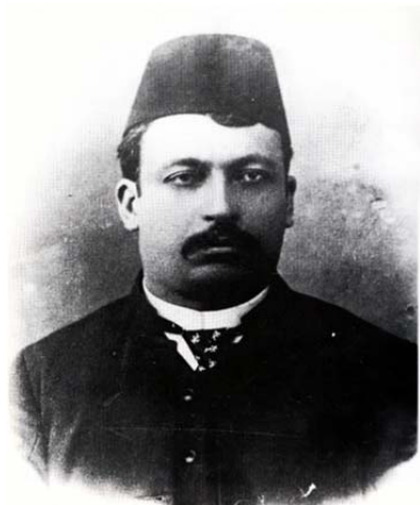
تصویر ۶. میرزا آقاخان کرمانی. بدون تاریخ. منبع: (کرمانی، ۱۳۵۷: ۲۹/۱)