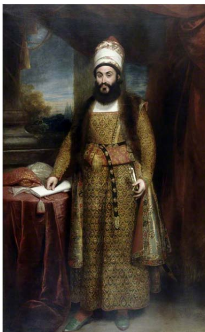
تصویر ۴: میرزا ابوالحسن خان شیرازی، فرستاده‌ی فوق‌العاده‌ی دربار فتحعلیشاه قاجار به دربار جورج سوم انگلستان. نقاشی از: سر ویلیام بیچی. کتابخانه‌ی بریتانیا. ۱۸۱۰ م. منبع: (رایت، ۱۳۶۸، ۱۰۴)

تا اواسط سده سیزدهم ق. در طبقات بالای اجتماعی ایران، لباس زنان و مردان (به استثنای حجاب زنان در اماکن عمومی) تفاوت چندانی در فرم، تزئینات، و پارچه نداشت؛ در ایران هنوز مردان و زنان خوش‌پوش تقریباً لباس و ظاهری مشابه داشتند؛ در تصاویر درباری دوران فتحعلیشاهی، جُبه‌های کمرباریکِ دامن‌بلند، کفش‌های پاشنه‌دار، ترمه‌های خوش‌نقش و رنگ، و انبوه مروارید و جواهر، اجزاء لباس مردان و زنان ایرانی هر دو بود. این صورت از سر و وضع مردان ایرانی، چنان با ظاهر مردان اروپایی تفاوت داشت که نمایندگان دربار فتحعلیشاه، مثل عسگر خان افشار یا میرزا