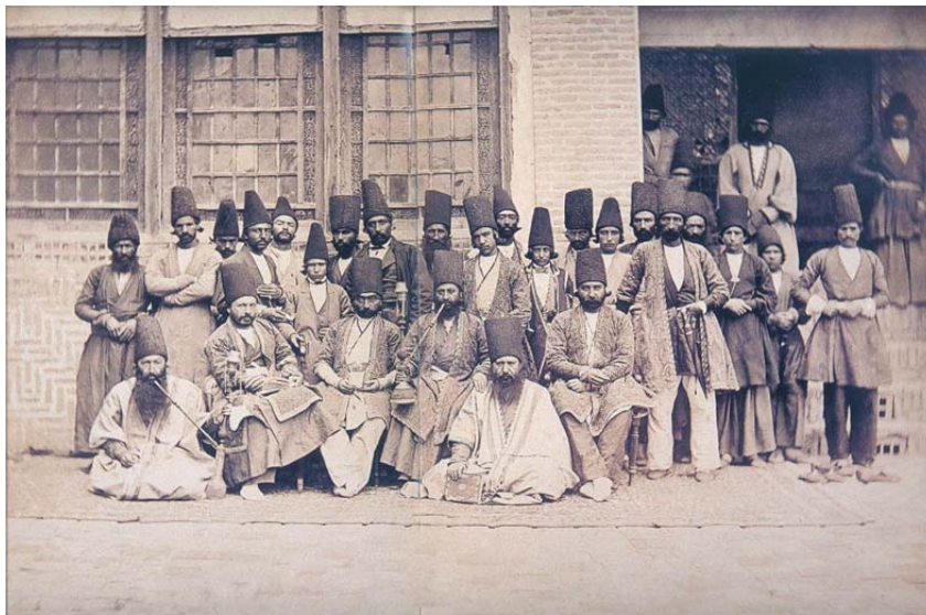
تصویر ۱. شخصیت‌های درباری یا جنبه‌ی جقه و کلاه بلند پوستی و شلوار گشاد ایرانی. دربار مظفرالدین میرزا ولیعهد در تبریز. ۱۲۷۸ ق. ۱۸۶۲ م.