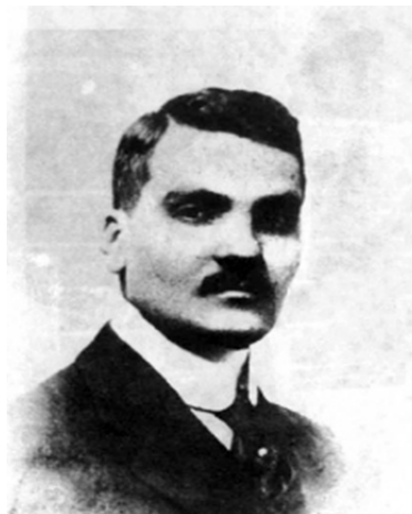
تصویر ۷. سیدحسین تقی‌زاده. بدون تاریخ. منبع: مؤسسه مطالعات تاریخ معاصر ایران؛ شماره آرشیو: ۱-۶۸۱۰ ع

تجددگرایان به‌عنوان یک گروه اجتماعی، برای اقتدا به فرهنگ و ال‌انتر اروپایی، می‌بایست خود را به‌لحاظ ریخت ظاهری، هم از سنت‌گرایان مذهبی، و هم اشرافی متمایز می‌نمودند. انگار این جریان دلالت بر این داشت که مذهب و اشرافیت دیگر قابلیت الگوسازی خود را برای گروه‌هایی از مردم از دست داده بود؛ نزد تجددگرایانی چون کرمانی ارزش‌هایی چون عقلانیت، وطن‌پرستی، و مردانگی، در طبقه‌ی روشنفکر نوظهور تجلی می‌یافت. نشانه‌های ارزشی گفتمان مشروطیت آشکارا در اینجا دیده می‌شود. از نگاه اینان لباس سنتی مردانه در وجه اشرافی آن، نشان سیستم سیاسی مهجور سلطنت کهن و اشرافیت فاسد قاجار، و در وجه مذهبی آن، نشان سنت مذهبی کهنی بود که با تمام توان در برابر تجدد می‌ایستاد. بدین‌سان نسلی از مردان در عصر مشروطه ظهور می‌یابند که تمایل داشتند خود را همچون شهروندان ملتی برابر با جهان مرفعی بنمایند، و لباس اروپایی برای آنان نشانه‌ی آن نظام شهروندی جهانی بود که آرزوی تعلق بدان را داشتند. آن گسست نسلی که در اثر آموزه‌های مدرن و شناخت فرهنگ اروپایی حتی در برخی خانواده‌های بسیار سنتی پدید آمده بود و کسانی چون تقی‌زاده را به اکتساب فرهنگ پوشاک اروپایی سوق می‌داد، در خانواده‌های بازاری که همواره بسیار متعهد به لباس سنتی ایرانی بودند نیز مشاهده می‌شد، و این نیز احتمالاً ناشی از نیاز این گروه‌های اجتماعی به تعامل با جهان بیرون بود. (تصاویر ۸ و ۹)