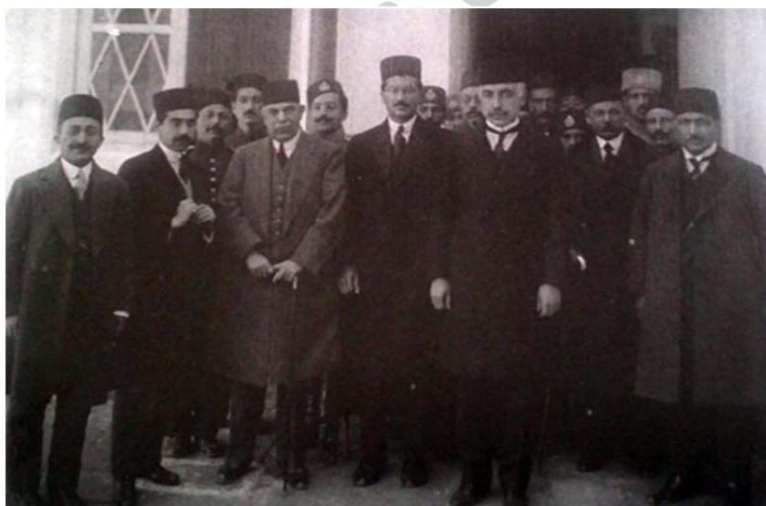
تصویر ۲. اعضاء کابینه‌ی حسن وثوق (وثوق‌الدوله). همگی ملبس به کت فراق، جلیقه، شلوار و کفش اروپایی، فوکل و کراوات، و کلاه کوتاه «مقوایی». اواخر دوران سلطنت احمد شاه قاجار. منبع: مؤسسه مطالعات تاریخ معاصر ایران. شماره آرشیو: ۱۹۵۲-۱ع