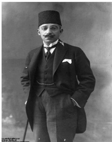
تصویر ۱۴. حسنعلی کمال هدایت (نصرالملک). تحصیل کرده حقوق در پاریس. نماینده ادوار اول و دوم مجلس شورای ملی و وزیر کابینه‌های مختلف. منبع: مؤسسه مطالعات تاریخ معاصر؛ شماره آرشیو: ۵۸۸۰-ع۱