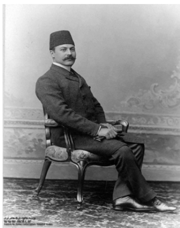
تصویر ۱۲. میرزا حسن خان مشیرالدوله (پیرنیا)، تحصیل کرده حقوق در مسکو. وزیر کابینه‌های مختلف و نخست‌وزیر دور سوم مجلس شورای ملی. شماره آرشیو: ۴۸۸۳-۱ع

تصویب کرد، با برگزاری آزمون، سالانه میان داوطلبان تحصیل در کشورهای اروپایی، سی نفر برگزیده و به اروپا روانه می شدند ۹ و در بازگشت بسیاری از آنان متأثر از نظام پوشاک اروپایی بودند. در این دوران شمار زیادی از مردان تجددگرا، وقتی در ممالک اروپایی به سر می بردند اغلب به آخرین مدهای لباس مردانه‌ی اروپایی ملبس می شدند و شماری از آنان در ایران نیز، نه از سر تفنن بلکه همواره لباس کامل اروپایی می پوشیدند؛ از جمله شخصیت‌های تجددگرایی چون میرزا ملکم خان، یا امین الدوله ۱۰ که «به اصطلاح از شیک پوش‌های آن زمان بود و همیشه با پیراهن دوخت فرنگ و کراوات دیده می شد.» (محبوبی اردکانی، ۱۳۵۷: ۳۸) در اوان اولین دستاوردهای مشروطه خواهی، کت و شلوار اروپایی لباس معمول تعداد زیادی از سیاستمداران ارشد در ایران بود، که به خوبی از عکس‌های رؤسا و بسیاری از نمایندگان مجلس شورای ملی نمایان است ۱۱ ؛ اما بسیاری از این دولت‌مردان دیگر الزاماً وابستگی‌ای به اشرافیت قاجار نداشتند بلکه جوانانی از خانواده‌های غیراشرافی بودند که در مدارس نوین آموزش دیده و با تحصیلات عالی در ایران یا اروپا به استخدام نهادهای اداری و دولتی درمی آمدند. این افراد هسته‌ی طبقه‌ی اجتماعی نوینی را در ایران شکل دادند که به تدریج گسترش یافت. (تصاویر ۱۲ تا ۱۵)