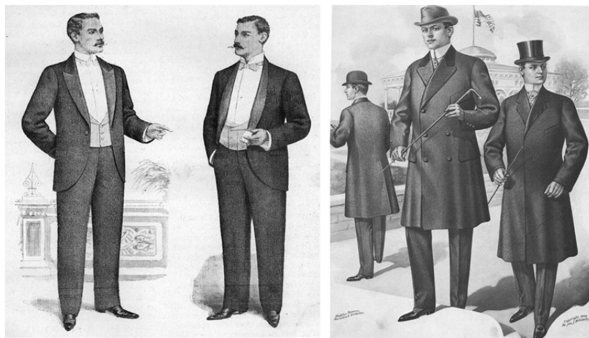
تصویر ۳. پوشاک مردانه در اواخر سده‌ی نوزدهم در اروپا و آمریکا با برخی از انواع رایج کت‌های مردانه راست: اُورکت «چسترفیلد»، ۱۹۰۱ م. چپ: «گت شام» یا «تاکسیدو»، ۱۸۹۸ م. منبع: (Druesedow, 1990: 98)

به این ترتیب، این مجموعه‌ی کت/جلیقه/شلوار، با پیراهن و گردن‌پوش (یقه‌ی بلند ایستاده با کراوات یا پایون، که در دوران مشروطه اصطلاح فرانسوی فُکُل ۲ (faux col) برای آن باب شد)، یعنی مجموعه‌ای که به‌طور کلی اکنون کت و شلوار خوانده می‌شود، از اواخر سده‌ی هفدهم اولین مراحل حیات طولانی خود را آغاز کرد، و تا پایان سده‌ی نوزدهم به‌صورتی که امروز رایج است تکامل یافت. (تصویر ۳) صنعتی شدن جوامع و تحولات اقتصادی و اجتماعی ناشی از آن در سده‌ی نوزدهم، نیاز به لباسی برای مردان بورژوازی نوین ایجاد کرده بود که ساده و کاربردی، و درعین حال، مظهر تعلق به عصر مدرن باشد، و تمامی وجوه اشرافی، زنانه، و متظاهرانه را از پوشاک مردان طرد نماید؛ راه‌حل این نیاز در «کت و شلوار» تیره و ساده متجلی شد. این لباس مردانه از زمان پیدایش چندان تغییر نکرد؛ ۳ انگار لباس مردان با ظهور کت و شلوار جهشی چنان نجومی داشت که بعد از آن دیگر نیازی به اصلاح آن نبود، درحالی که لباس زنانه مداوماً دستخوش تحول بود، و مدت‌ها پس از لباس مردان واجد کیفیات مدرن شد. ظهور این لباس جدید مردانه، نقطه‌ی آغازی در ظهور زیباشناسی نوینی در مفهوم مردانگی، و آن نیز مشخصاً نوعی زیباشناسی انگلیسی بود. در انگلستان سده‌ی هفدهم، «منتقدان سیاسی تجملات درباری را با سنت آزادی‌خواهی انگلیسی ناسازگار می‌دیدند؛ منتقدان مذهبی، شیفتگی به منسوجات لطیف را