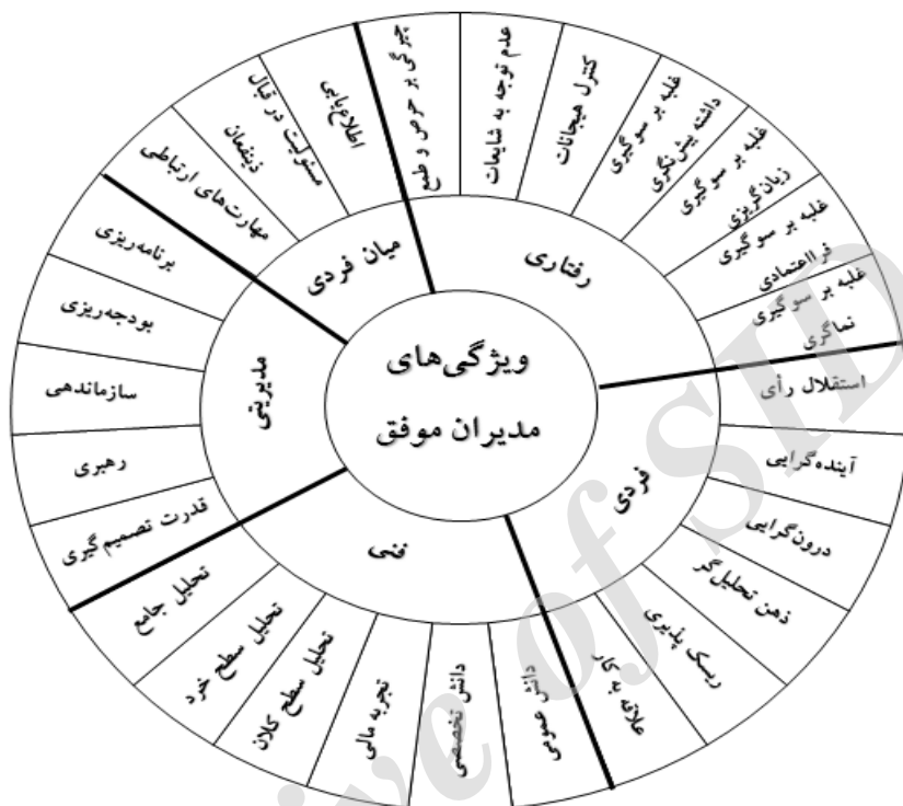
شکل ۲: الگوی مفهومی ویژگی‌های مدیران سرمایه‌گذاری موفق