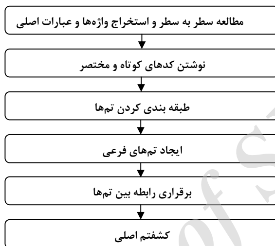
نمودار ۱: فرآیند تجزیه و تحلیل داده‌ها

تجزیه و تحلیل تم‌ها استفاده شد که فرآیند تجزیه و تحلیل داده‌ها در نمودار ۱ نشان داده شده است: