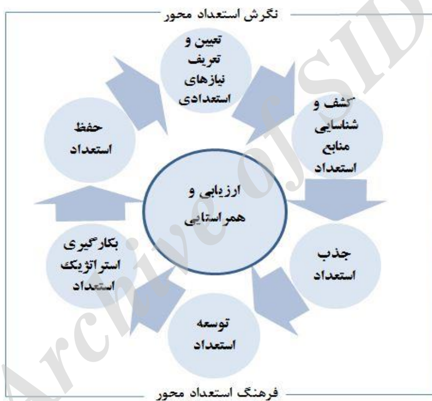
شکل ۲: مدل پیشنهادی فرایند مدیریت استعداد در دانشگاه‌های استعداد محور

در این مطالعه سعی شده است به همه ابعاد فرایند مدیریت استعداد اعضای هیات علمی به عنوان کلیدی ترین پست در دانشگاه‌ها توجه شود. با توجه به آنچه که در جریان پژوهش تشریح گردید، شکل ۲ مدل پیشنهادی فرایند مدیریت استعداد اعضای هیات علمی را در دانشگاه‌های استعداد محور نشان می‌دهد.