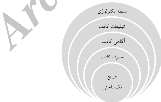
شکل ۱. هژمونی تکنولوژی بر جامعه از نگاه مارکوزه

مارکوزه در مقاله خود با عنوان «برخی کارکردهای اجتماعی تکنولوژی مدرن (۱۹۴۱)» این بحث را مطرح می‌کند که تکنولوژی در عصر حاضر در حال سازماندهی و تغییر روابط اجتماعی و ارائه‌کننده افکار و الگوهای رفتاری و ابزاری برای کنترل و سلطه شده است. در حوزه فرهنگ، تکنولوژی باعث ایجاد فرهنگ توده می‌شود که افراد را در الگوهای مسلط فکری و رفتاری گرفتار می‌کند. بنابراین، ابزار قدرتمندی برای کنترل اجتماعی و سلطه می‌سازد (کلنر، ۱۳۸۶).