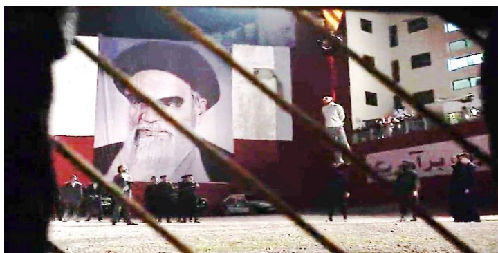
تصویر ۷. لانگ شاتی که در پس‌زمینه‌اش تصویر امام خمینی دیده می‌شود [S3/E12/37:50].

بعد از مدتی در اپیزود دوازدهم فصل سوم، اعدام برادی در جایی اتفاق می‌افتد که پرتره‌ی بزرگی از آیت‌الله خمینی از دیوار آویزان است (تصویر شماره ۷). برادی دو سه بار در لانگ شات (Long shot)، با تصویر پرتره‌ی در پس‌زمینه نشان داده می‌شود. یکی از کارکردهای لانگ شات در سینما و تلویزیون، نشان دادن همه‌ی افراد، اشیاء و فرایندهای موجود در صحنه به صورت یک کل است که به این ترتیب به مخاطب این اجازه را می‌دهد که تمام اتفاقاتی را در حال وقوع است در یک تصویر درشت دنبال کند؛ بنابراین، مخاطب با دیدن این صحنه در لانگ شات، به‌طور ناخودآگاه می‌تواند به این نتیجه برسد که خمینی تا حدی مسئول کل آن اتفاق غم‌انگیز و سرنوشت تلخ برادی است.