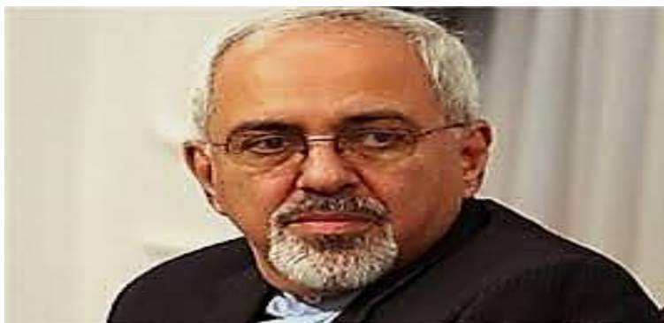
تصویر ۳. دکتر محمدجواد ظریف، وزیر امور خارجه ایران از سال ۲۰۱۳

رویکرد اسلام‌رومیایی هالیوود نسبت به مسلمانان و اسلام: ۱۳۱