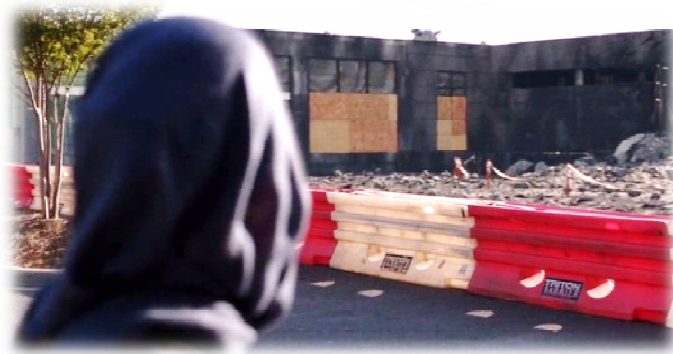
تصویر ۱۳. یکی شدن خرابه‌های بمب‌گذاری سیا با تصویر فرح [S3/E2/15:48]

رویکرد اسلام‌رومیایی هالیوود نسبت به مسلمانان و اسلام: ۱۳۹