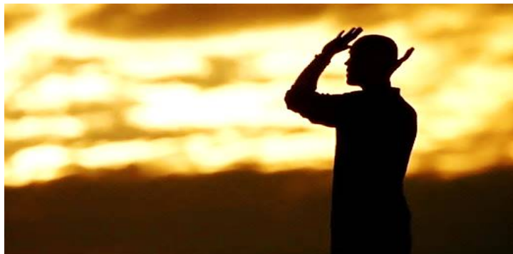
تصویر ۵. نمازخواندن برادی با پس‌زمینه‌ای از یک غروب دلگیر [S3/E11/11:20]

رویکرد اسلام‌رومیایی هالیوود نسبت به مسلمانان و اسلام: ۱۳۳