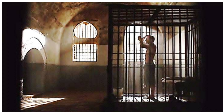
تصویر ۶. برادی در آرامش تمام در زندانی در ایران خودش را می‌شوید [S3/E12/29:46].