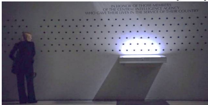
تصویر ۱۰. ستاره‌هایی که به افتخار اعضای از دست‌رفته‌ی سازمان سیا کشیده می‌شوند [S3/E12/57:10].

یکی از مهم‌ترین و البته زیرپوستی‌ترین پیغام‌هایی که سریال هوملند در تلاش است به مخاطب خود انتقال بدهد، تقسیم‌بندی مقاصد شخصیت‌هایش است. همه‌ی افرادی که در فکر انتقام وحشیانه و ایجاد وحشت و ترور هستند، در نهایت به مرگ و سرنوشتی تلخ دچار می‌شوند. این ایدئولوژی هم در مورد شخصیت‌های غربی مانند ویلیام والدن (William Walden) معاون اول رئیس‌جمهور آمریکا، دیوید ایستس (David Estes) مدیر سازمان سیا) و هم درباره‌ی مسلمانانی همچون ابونظیر، تام واکر (Tom Walker)، دانش‌اکبری و غیره به‌کاربرده می‌شود. البته خود برادی مورد استثنای فیلم است، طبق خط داستانی فیلم، کری عاشق برادی بود و فصل سوم در حالی به پایان می‌رسد که او بچه‌ی برادی را باردار است و در سکانس آخر اپیزود آخر، کری با اضافه کردن ستاره‌ای دیگر به صدها ستاره‌ای که بر روی دیواری در سازمان سیا کشیده شده‌اند، به‌طور نمادین و طبق تحلیلی نشانه شناسانه، می‌خواهد نشان بدهد که برادی و یاد و خاطره‌اش همواره زنده خواهد بود (تصاویر ۱۰ و ۱۱).