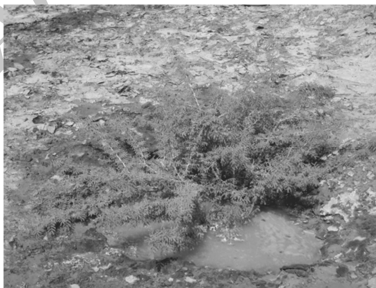
شکل ۱- نهالکاری با گونه مغیر - پایان سال اول

به منظور مقایسه میزان رشد نهالها، در پایان سال اول و دوم به اندازه گیری سطح تاج پوشش نهالها برای هر گونه به روش اندازه گیری سطح تاج همه پایه ها، اقدام گردیده است. (آنچه که در این تحقیق به عنوان رشد مدّ نظر بوده، میزان تاج پوششی است که در پایان سال اول و دوم ایجاد می نماید)؛ همچنین درصد زنده مانی نهالها و طول فصل خزان در منطقه نیز به تفکیک گونه برآورد شده است. اشکال (۱) و (۲) وضعیت دو گونه مغیر و سمر را به ترتیب در پایان سال اول و دوم نشان می دهد.