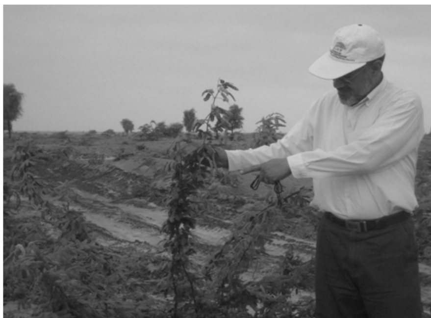
شکل شماره ۲- نهال سمر در پایان سال دوم