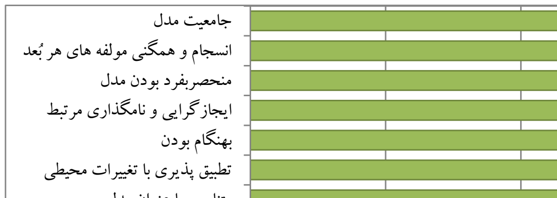
شکل ۲: میانگین امتیازات کسب شده‌ی مؤلفه‌های مدل از نگاه خبرگان

در ادامه برای تأیید اعتبار و روایی مدل پیشنهادی پژوهش، به دریافت دیدگاه خبرگان در این زمینه پرداخته شده است. در این راستا، ۸ سؤال مدنظر است: جامعیت مدل، انسجام و همگنی مؤلفه‌های هر بُعد، منحصر به فرد بودن، ایجاز‌گرایی و نامگذاری مرتبط، بهنگام بودن، تطبیق‌پذیری با تغییرات محیطی، متناسب با عنوان مدل، مناسب و گویا بودن الگوی گرافیکی (Bandarian et al, 2012 & Zahedi and Sheikh, 2010 & Kianfar, 2018). بدین منظور برای سنجش میزان موافقت خبرگان با هر سؤال، طیف لیکرت ۵ قسمتی (از خیلی کم (امتیاز ۱) تا خیلی زیاد (امتیاز ۵)) در نظر گرفته شد. سپس با تشکیل پانل خبرگان متشکل از ۱۵ خبره در زمینه‌ی مدیریت و حفاظت از جاذبه‌های ژئوتوریستی، سؤالات مطرح و پرسیده شد. مطابق با شکل ۲، میانگین آماری همه سؤالات بیش از میانگین نظری (۳) می‌باشد. بر این اساس، میانگین آماری سؤالات بدین شکل است: جامعیت مدل برابر با ۴/۱۱، انسجام و همگنی مؤلفه‌های هر بُعد برابر با ۳/۹۸، منحصر به فرد بودن مدل برابر با ۳/۸۸، ایجاز‌گرایی و نامگذاری مرتبط برابر با ۴/۲۱، بهنگام بودن برابر با ۳/۷۴، تطبیق‌پذیری با تغییرات محیطی برابر با ۴/۰۲، متناسب با عنوان مدل برابر با ۴/۴۴ و مناسب و گویا بودن الگوی گرافیکی برابر با ۴/۱۳ (شکل ۲).