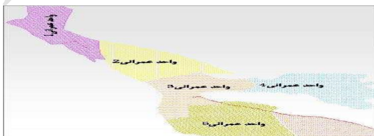
شکل ۲. موقعیت واحدهای عمرانی ۵ گانه دشت اریض