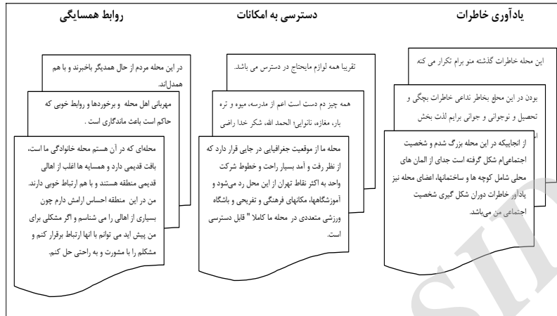
شکل ۲. مرحله سوم: نمایه‌سازی داده‌ها