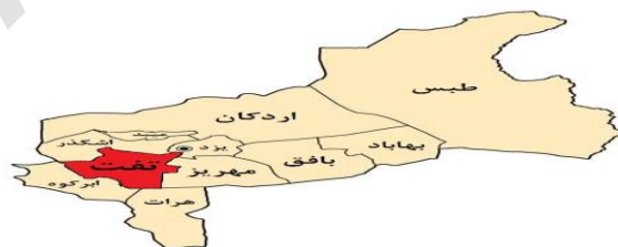
شکل ۱. موقعیت جغرافیایی استان یزد و شهرستان تفت

در پژوهش حاضر برای بررسی موشکافانه مسئله تحقیق از رویکرد کیفی و روش نظریه بنیادی بهره‌گیری شده است. در این روش، مجموعه‌ای منطقاً منسجم از داده‌ها و روندهای تحلیلی با هدف ساخت نظریه فراهم می‌شود. این روندها به شناسایی الگوهای درون داده‌ها کمک کرده و محققان با تحلیل آنها می‌توانند نظریه‌ای بسازند که در عمل نیز معتبر باشد. شهرستان تفت، در جنوب غربی استان یزد با وسعتی حدود ۱۴ کیلومتر مربع، واقع در عرض جغرافیایی ۳۱ درجه و ۴۵ دقیقه و طول جغرافیایی ۵۴ درجه و ۱۲ دقیقه واقع شده است. مهم‌ترین علت انتخاب شهر تفت به عنوان مورد مطالعه شرایط یکسان توپوگرافی و اقلیم در محدوده قنات‌های آن است.