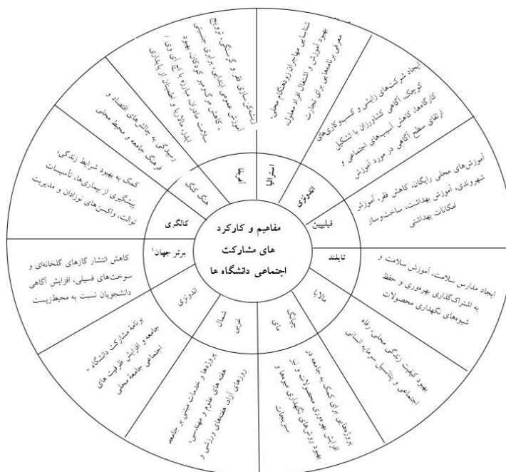
شکل ۱. مفاهیم و کارکردهای مشارکت اجتماعی دانشگاه‌ها در جهان