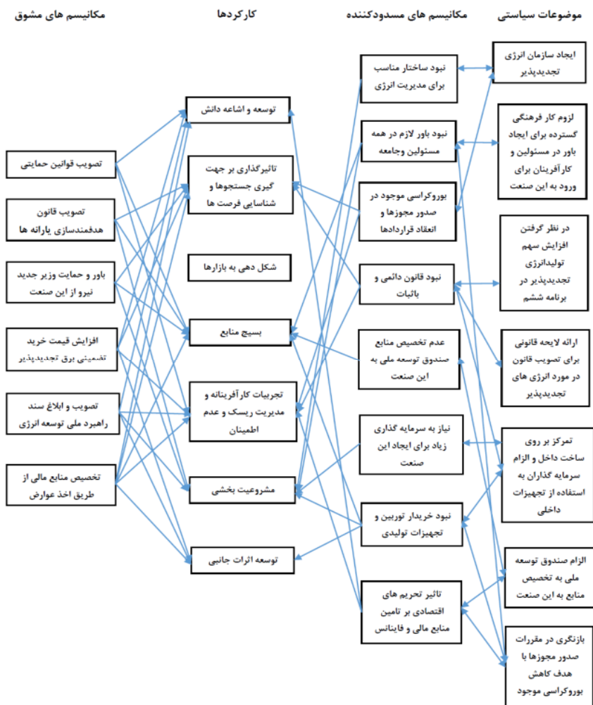
شکل ۲. مکانیسم‌های مشوق و مسدودکننده، کارکردها و موضوعات سیاستی درباره وضعیت به کارگیری انرژی بادی در ایران