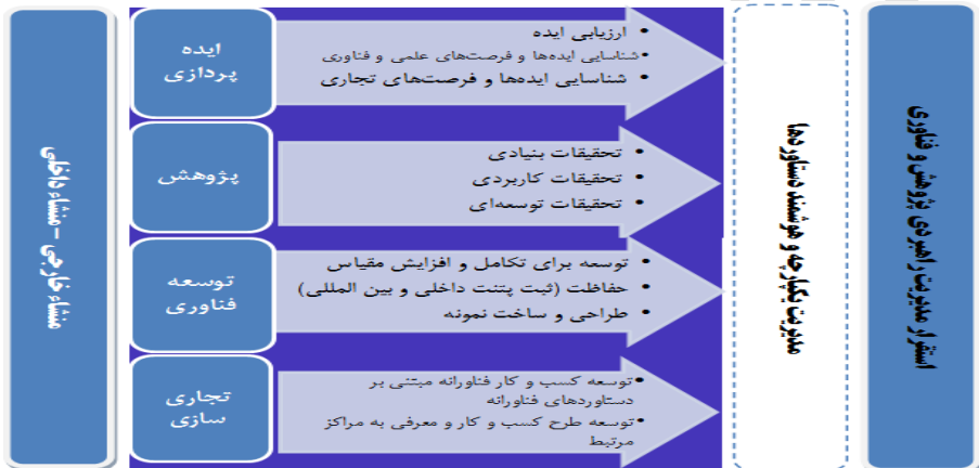
شکل ۴. مسیر تکامل پژوهش و فناوری برای سازمان‌های حمایت‌کننده از پژوهش و فناوری

فوق، یک الگوی جامع مطابق شکل ذیل توسعه یافت که در ادامه به تشریح آن پرداخته می‌شود. این الگوی جامع مدیریت راهبردی پژوهش و فناوری از نظر سازماندهی اجرای نوآوری فناورانه بر مبنای تلفیق دو الگوی «مرحله غالب» و «پروژه غالب» است تا از مزیت‌های هریک از رویکردها بهره‌برداری و از معایب آنها دوری کند.