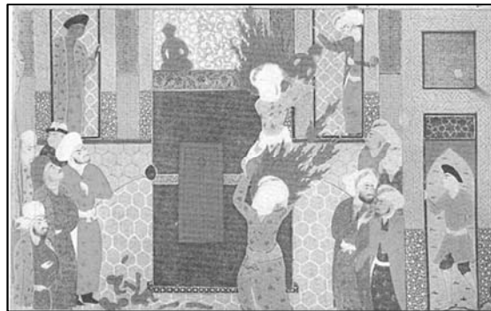
تصویر (۷): علی علیه السلام بر روی شانه‌های پیامبر صلی الله علیه و آله و سلم ، بت‌ها را می‌شکنند، روضه الصفا، دوره صفوی ۱

نموده است. همان طور که از خود حضرت نقل شده که فرمود: «به خدا سوگند در قلعه خیبر را نه به نیروی جسمانی، بلکه با نیروی رحمانی و الهی از جای کندم.» ۱ به هر حال، هر مخاطبی در مواجهه با این نگاره، به شخصیت معنوی و مقدس حضرت و خارق العاده بودن عمل او پی می‌برد. جلوه مهم تصویری دیگری که در رابطه با شمایل حضرت علی علیه السلام جلب توجه می‌کند، تصویرسازی یکسان و یک شکل شمایل حضرت علی علیه السلام و پیامبر صلی الله علیه و آله و سلم است. نگارگر، شمایل هر دو بزرگوار را با شعله‌های آتش یک اندازه، روبند چهره و عمامه یک شکل، لباس با نقش و رنگ یکسان و حتی پیکر یک اندازه به تصویر درآورده است. با این تمهیدات، نگارگر توانسته مقام و منزلت یکسان حضرت علی علیه السلام و پیامبر اسلام را به تصویر درآورد؛ همان طور که شیعیان از پیامبر صلی الله علیه و آله و سلم نقل می‌کنند که فرمود: «علی برای من به منزله هارون است برای موسی، جز اینکه پس از من پیغمبری نخواهد بود». ۲