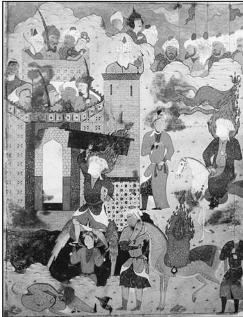
تصویر (۶): فتح خیبر، فالنامه، دوره صفوی ۱

این نگاره مربوط به نسخه فالنامه تهماسبی است که در دوره اوج گرایش‌های مذهبی و شیعی نزد شاه تهماسب تولید شده است. (تصویر ۶) نگارگر، شمایل حضرت را با روپند چهره و شعله‌های آتش دور سر به تصویر درآورده است. از این طریق، جنبه تقدس شخصیت حضرت، نشان داده شده است. با این حال، مهم‌ترین عنصر تصویری در رابطه با شمایل حضرت، وجود فرشته‌ای است که حضرت، پاهای خویش را بر روی دستان او قرار داده است. با این نشانه تصویری، نگارگر به روشی نمادین، بر قدرت اعجاز‌گونه و تکیه حضرت بر نیرویی فرازمینی و آسمانی تأکید