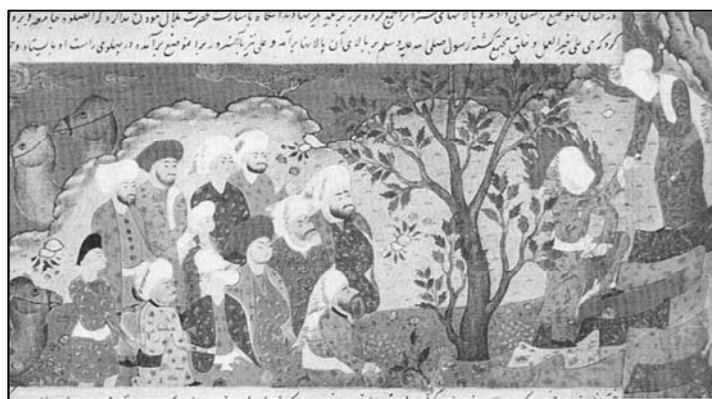
تصویر (۸): غدیر خم، روضه الصفا، دوره صفوی ۱