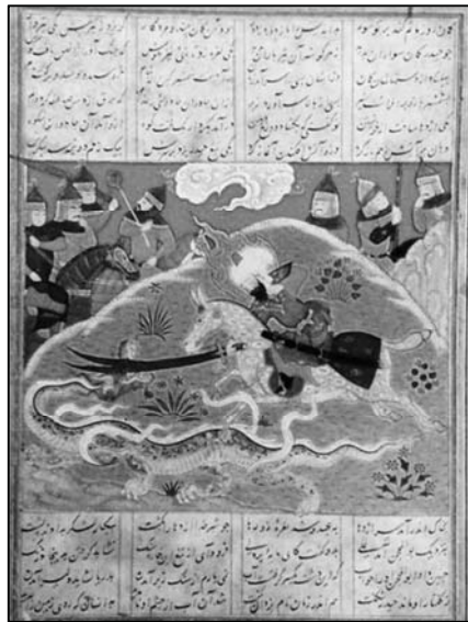
تصویر (ع): نبرد حضرت علی علیه السلام

مصور شده است. قراقویونلوها، سلسله‌ای شیعی بودند و خاوران‌نامه تحت حمایت پیر بوداق پسر جهان‌شاه که در اواخر سده پانزدهم / نهم در شیراز حاکم بود، مصور گشت و احتمالاً مصورسازی این نسخه خطی شیعی، تحت سرپرستی خلیل، پسر اوزون حسن ۱ و توسط همان هنرمندانی که بعد از مرگ پیر بوداق در شیراز باقی ماندند، ادامه یافت. ۲ خاوران‌نامه ، جنگ‌ها و دلاوری‌های حضرت علی علیه السلام را روایت می‌کند و در کنار حوادث تاریخی، جنگ حضرت با اژدها و دیو و جن نیز دیده می‌شود.