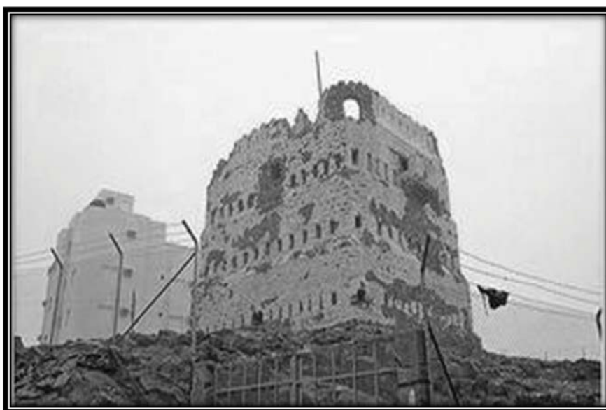
بازمانده قلعه‌های بنی‌نضیر در شهر مدینه