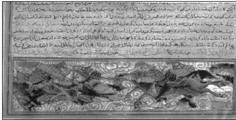
شکل (۲): جنگ بدر، جامع‌التواریخ رشیدی، ۷۱۴ هجری، موزه کتابخانه توبقایی استانبول ۱