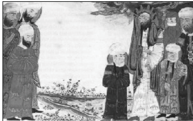
شکل (۴): نمایندگان مسیحیان نجران و آل عبا، آثار الباقیه بیرونی، حدود ۷۰۷ ق، نسخه متأخر بر پایه نسخه ادینبورگ، کتابخانه ملی پاریس ۳

خداوند است. بنابراین دعا یا نفرین ایشان نیز در روز مباحله به اذن خداوند مستجاب می‌شد. در کنار حضرت فاطمه علیها السلام ، حضرت علی علیه السلام در سمت راست تصویر ایستاده است. با استناد به آیه مباحله، واژه «انفسنا» در این آیه، به حضرت علی علیه السلام اشاره دارد و منظور از «نفس» این است که علی علیه السلام مثل و مانند پیامبر صلی الله علیه و آله است. ۱ همین‌طور بر طبق آیه «أَفَمَنْ يَهْدِي إِلَى الْحَقِّ أَحَقُّ أَنْ يُتَّبَعَ أَمَّنْ لَا يَهْدِي إِلَّا أَنْ يُهْدَىٰ فَمَا لَكُمْ كَيْفَ تَحْكُمُونَ» ۲ از انطباق جمله «انفسنا» به «علی علیه السلام » می‌توان پلی به سوی ولایت و امامت زد و در موضوع این نگاره، ولایت به‌حق حضرت علی علیه السلام را هم ثابت کرد. در دو طرف پیامبر صلی الله علیه و آله نیز حسنین علیهما السلام مصور شده‌اند تا بزرگی و منزلت آل عبا در درگاه خداوند تأکید شود. بنابراین، پیامبر صلی الله علیه و آله در این نگاره به همراه خانواده خود نقاشی شده و از دیگر نزدیکان پیامبر صلی الله علیه و آله کسی حاضر نیست. نگارگر با این کار علاوه بر نمایش واقعه مباحله، باورها و اعتقادات شیعه را براساس مدارک مستند با مضامین مذهبی در نسخه نفیسی چون آثارالباقیه رقم زده و مانوس بودن پیامبر صلی الله علیه و آله با آل عبا و برحق بودن علی علیه السلام را بیان کرده است. درحقیقت نگارگران، رویداد تاریخی و مذهبی‌ای را به تصویر کشیده‌اند که از وجه سیاسی و اجتماعی نیز برخوردار است. در اینجا نگارگر به اصل واقعه وفادار بوده و جریان مباحله را با توجه به متن کتاب به شیوه‌ای بیان کرده که در راستای مشروعیت دینی و مذهبی حکام ایلخانی و پیشبرد اهداف آنها باشد.