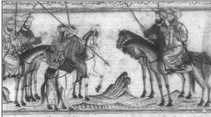
شکل (۱): پیامبر صلی الله علیه و آله و حضرت علی علیه السلام و حمزه را به مأموریت در جنگ بدر می‌فرستد

همچنین، آشنایی با حضرت علی علیه السلام و فداکاری‌ها و رشادت‌های ایشان به‌عنوان شخصیت دوم اسلام بعد از پیامبر صلی الله علیه و آله ، راه را برای گرایش حکام ایلخانی به تشیع باز کرد. به‌نظر می‌رسد یکی از دلایل توجه نگارگران به رشادت‌ها، دلآوری‌ها و جنگاوری‌های حضرت علی علیه السلام مثلاً در جامع‌التواریخ رشیدی - و حمایت حکام ایلخانی از این نگارگری‌ها آن بود که حکام از تأثیر این نگاره‌ها بر مقبولیت و مشروعیت حکومت خود آگاهی داشتند. در شکل‌های ۱ و ۲ ضمن اینکه به نقش حضرت علی علیه السلام در جهادهای صدراسلام تأکید شده، جهاد سیاسی و دینی مسلمانان با کفار تصویر شده است.