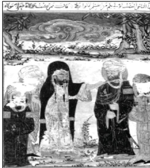
شکل (۵): پیامبر ﷺ علی را جانشین خود اعلام می‌کند، آثارالباقیه بیرونی، نسخه متأخر بر اساس نسخه ادینبورگ، کتابخانه ملی پاریس ۱

مقبولیت و مشروعیت حکام، از طریق تهیه نسخ خطی در تعداد زیاد و توزیع آن در میان دوستان و دانشمندان و حکام سرزمین‌های دیگر میسر بود.