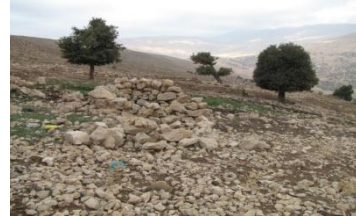
شکل ۱۱. محوطه تایک ۷ (MK 34)، نمای عمومی، دید از شمال شرق (خسروزاده، ۱۳۹۰)