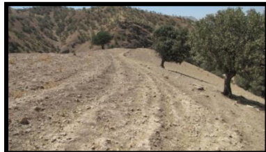
شکل ۱۲. محوطه چشمه فولک ۸ (MK 498)، نمای عمومی، دید از شمال غرب (خسروزاده، ۱۳۹۰)