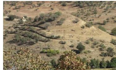
شکل ۹. محوطه تپه قبرستان سرخون علیا (MK 84) (خسروزاده، ۱۳۹۰)