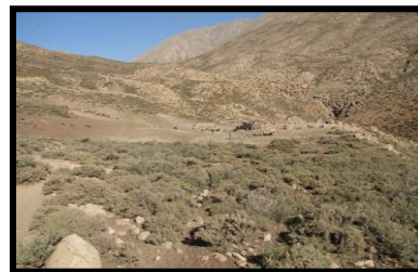
شکل ۳. نمای عمومی منطقه هفت‌چشمه، دید از جنوب (خسرورزاده، ۱۳۹۰).