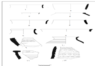
شکل ۱۴. منتخبی از طرح سفال‌های ساده ایلامی (خسروزاده، ۱۳۹۰).