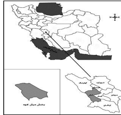
شکل ۱. موقعیت منطقه مورد مطالعه در استان چهارمحال و بختیاری و ایران