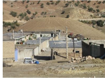
شکل ۷. محوطه گرچگاه ۵ (MK 65)، دید از غرب (خسروزاده، ۱۳۹۰)