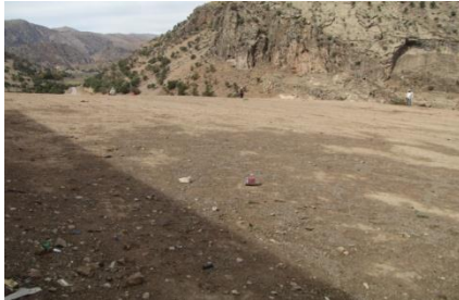
شکل ۸. محوطه سرزرد ۴ (MK 78)، دید از شمال (خسروزاده، ۱۳۹۰)