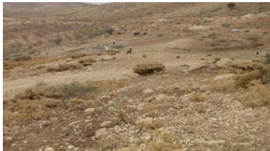
شکل ۱۰. محوطه تایک ۱ (MK 28)، نمای عمومی، دید از جنوب (خسروزاده، ۱۳۹۰)