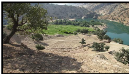
شکل ۴. رود بازفت، دید از شمال (خسرورزاده، ۱۳۹۰).