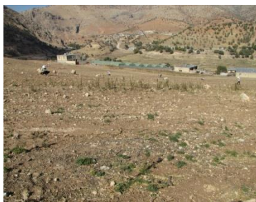
شکل ۶. محوطه گرچگاه ۲ (MK 62)، دید از جنوب (خسرورزاده، ۱۳۹۰)