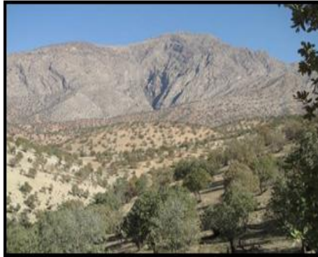
شکل ۲. چشم‌انداز بخش‌های پست و مرتفع بخش میان‌کوه، دید از شمال (خسرورزاده، ۱۳۹۰).