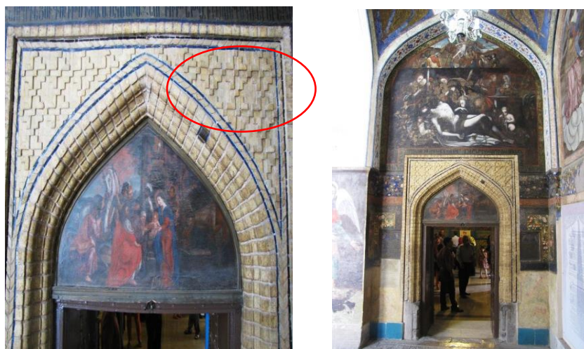
شکل ۴ و ۵. دیوارنگاره بوم‌پارچه، قسمت بالای درگاه ورودی ضلع شمالی و در زیر قوس آجری کلیسای وانک اصفهان

کلیسا و در زیر قوس آجری، نقاشی زیبایی وجود دارد با موضوع مسیح کودک در آغوش مریم مقدس که جزئی از معماری بناست. با بررسی میدانی صورت گرفته متوجه شدیم که این اثر در واقع یک دیوارنگاره بوم‌پارچه است، یعنی زمان خلق اثر، نقاشی بر روی کرباس اجرا شده (در حال حاضر لبه‌های کرباس با دقت زیاد دیده می‌شود) و سپس بر روی تخته چوبی و سطح دیوار میخکوب شده است، به گونه‌ای که جزئی از معماری دیده می‌شود (شکل ۴ و ۵). در ادامه کار، قطعات باریک و بلند چوب به عنوان نوعی قاب بر روی اثر میخکوب شده و باعث گردیده که لبه کرباس دیده نشود. معلوم نیست که این اثر را کدام هنرمند نقاش و در کدام کشور اجرا کرده است. نقاشی رنگ و روغن است و به شیوه اروپایی اجرا شده است.