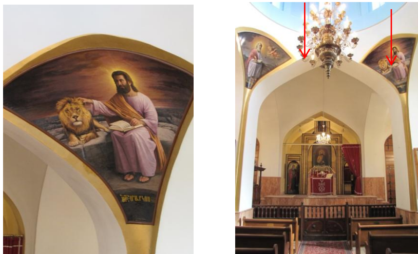
شکل ۸ و ۹. دیوارنگاره‌های بوم‌پارچه در ضلع شرقی و قسمت زیرین گریو گنبد کلیسای مریم تبریز

وجود ندارند و نقاشی‌های موجود، که قدمت زیادی ندارد، بر روی کرباس اجرا شده و بر سطح دیوار چسبانده شده‌اند.