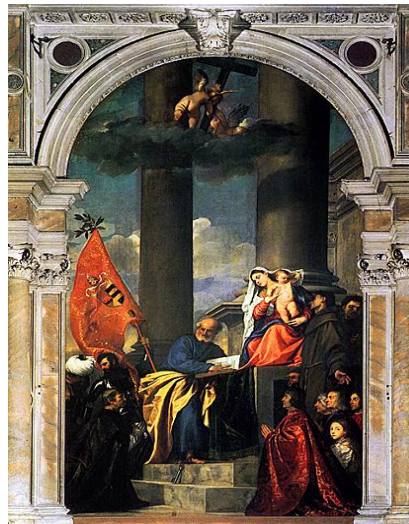
شکل ۱. دیوارنگاره بوم‌پارچه، مریم مقدس با اعضای خاندان پزارو (دیویس، ۱۳۸۸: ۵۷۸)

در این پژوهش، داده‌ها و اطلاعات اولیه به روش مطالعه، مشاهده، مصاحبه و غیره گردآوری شده و با استفاده از روش‌ها و فنون آماری و معیارهای پذیرفته‌شده مورد تجزیه و تحلیل قرار گرفته است. با توجه به نوع و ضرورت مسأله پژوهش حاضر، دو رویکرد نظری و تاریخی را در آن مد نظر قرار داده‌ایم.