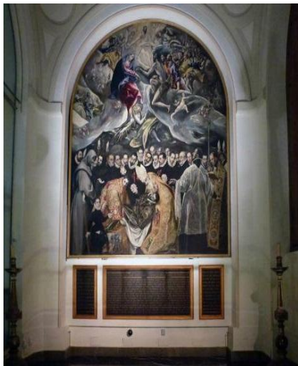
شکل ۲. دیوارنگاره بوم‌پارچه، خاکسپاری کنت اورگاز (دیویس، ۱۳۸۸: ۶۲۰)

نوتردام در مونترال اجرای ویلیام برسی ۱ مربوط به اوایل قرن نوزدهم (Roberge, Forest; 2010: 16).