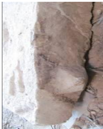
۵. برآمدگی و فرورفتگی لبه سنگ مزارها