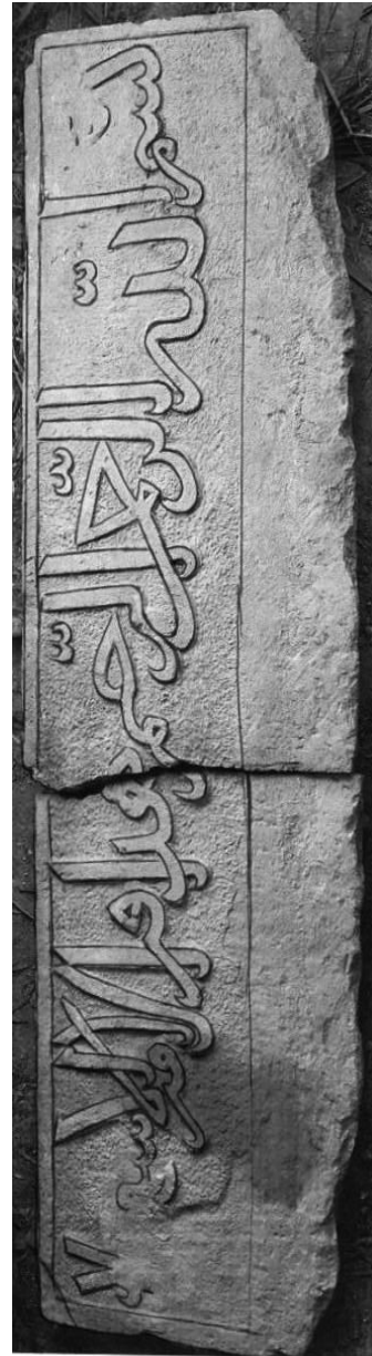
۱. شروع متن کتیبه.