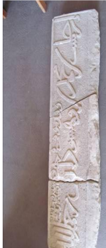
۳. بخش سوم تصویر