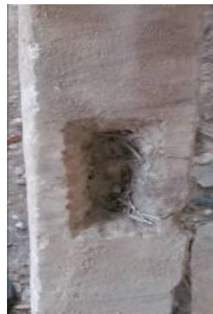
۵. برآمدگی و فرورفتگی لبه سنگ مزارها