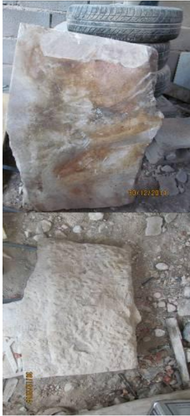
۴. تصویر پشت و رو قطعه سنگ چهارم (بدون نوشته)

تداوم حضور و قدرت آل بویه در فارس، پس از انقراض رسمی (بر پایه گورنوشته‌ای از سده هفتم هجری مکتشفه در فورگ داراب) / ۶۱