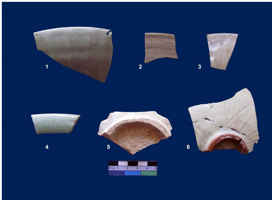
شکل ب. نمونه‌هایی از سفال‌های پراکنده بر سطح محوطه شیف (۱)

خرمای بصره و ظروف چینی از جمله واردات شیف بود. گزارشی از اوایل سده هفتم هجق نشان می‌دهد که یک کشتی با بیست هزار بار خرما متعلق به تاجری کازرونی از بصره به شیف رسید (محمود بن عثمان، ۱۳۵۸: ۴۳۶). مقصد نهایی محموله این کشتی می‌توانست کازرون و شیراز باشد. از سوی دیگر وفور قطعات ظروف چینی معروف به سلادن ۱ در محوطه شیف (توفیق‌یان، ۱۳۹۳: ۵۶، ۱۰۲؛ همچنین نک: شکل ب) نشانه قرار گرفتن این بندر در مسیر تجارت دریایی ایران با بنادر چین و حوزه اقیانوس هند در عصر ایلخانان است.