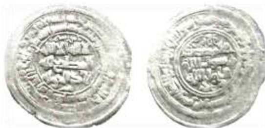
شکل شماره ۱۲: سکه مربوط رستم بن شروین محل ضرب: فریم، سال ۳۶۵ (ق.ه) از جنس درهم (رضایی باغ بیدی، ۱۳۹۳: ۴۷۵).

۵- سکه‌ای مربوط شهریار بن رستم از جنس نقره بیلون، محل ضرب آن فریم و سال ضرب آن ۳۷۳ (ق.ه) به شرح ذیل است. در قسمت وسط سکه «لا اله الا الله، المک عضدالدوله و تاج المله، مؤید الدوله ابومنصور، وحده لا شریک له، الطائع له، شهریار بن رستم» حاشیه اول روی سکه «بسم الله، ضرب هذا الدرهم بفریم سنه ثلاث و سبعین و ثلاثمائه» پشت سکه «الله، محمد رسول الله، علی ولی الله، شهریار بن رستم» و حاشیه پشت سکه: «محمد رسول الله ارسله بالهدی و دین الحق لیظهره علی الدین کله و لو کره المشرکون» نوشته شده است.