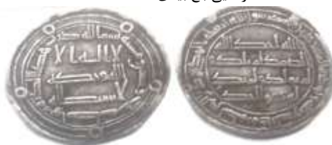
شکل شماره ۵: سکه اموی مربوط ولید بن یزید، محل ضرب: واسط سال ضرب ۱۲۶ (ق.ه) از جنس درهم (وثیق، ۱۳۸۷: ۴۷)

در اواخر حکومت امویان، سکه‌های عبدالله بن معاویه بن عبدالله بن جعفر بن ابی طالب (ع) که از آنها به‌عنوان سکه شورشیان یاد می‌کنند، ضرب گردید. برخی از مورخین نیز قیام عبدالله بن معاویه را قیام شیعی و سکه‌های او را نخستین سکه‌های شیعی می‌دانند. بر متن روی سکه‌های درهمی و فلوسی (مسی) جعفر عبارت «لا اله الا الله، وحده لا شریک له» و در حاشیه آن شعار طرفداران خاندان پیامبر (ص) «قل لا اسئلكم علیه اجراً الا