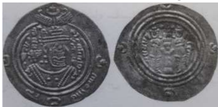
شکل شماره ۳: سکه عرب - ساسانی مربوط به خسرو پرویز، محل ضرب نهاوند، سال ۳۰ یزدگردی (۴۱ ه.ق) (ر.ک. رضایی باغ بیدی: ۱۳۹۳)

عباراتی چون «برکه» «بسم الله» «جید» (۴) ، «الله» و «الله الحمد» نوشته شده و در پشت آنها نیز نقش آتشدان ساسانی با دو نگهبان تصویر شده است. نامه ضرابخانه در سمت راست و تاریخ ضرب نوشته شده است. همچنین در کنار آتش درون آتشدان هلال و ستاره ای دیده می شود که معمولاً هلال در سمت راست و ستاره در سمت چپ آتش است. پژوهش ها نشان می دهد که وزن سکه های خسرو با واژه «أقد» بیشتر از سکه های او بدون این واژه است، همچنین سکه هایی که در حاشیه آنها «الله» نوشته شده نسبت به سکه های دیگر اندکی خالص تر یا سنگین تر هستند.