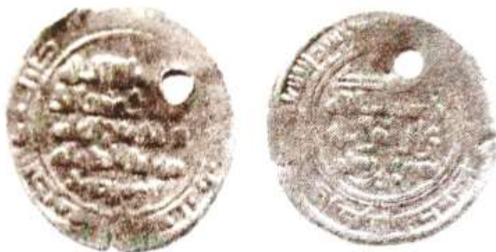
شکل شماره ۱۳: سکه مربوط شهریار بن رستم محل ضرب: فریم، سال ۳۷۳ (ق.ه) از جنس درهم بیلون (رضایی باغ بیدی، ۱۳۹۳: ۴۷۶)

۵- سکه‌ای مربوط شهریار بن رستم از جنس نقره بیلون، محل ضرب آن فریم و سال ضرب آن ۳۷۳ (ق.ه) به شرح ذیل است. در قسمت وسط سکه «لا اله الا الله، المک عضدالدوله و تاج المله، مؤید الدوله ابومنصور، وحده لا شریک له، الطائع له، شهریار بن رستم» حاشیه اول روی سکه «بسم الله، ضرب هذا الدرهم بفریم سنه ثلاث و سبعین و ثلاثمائه» پشت سکه «الله، محمد رسول الله، علی ولی الله، شهریار بن رستم» و حاشیه پشت سکه: «محمد رسول الله ارسله بالهدی و دین الحق لیظهره علی الدین کله و لو کره المشرکون» نوشته شده است.