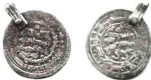
شکل شماره ۱۱: سکه مربوط رستم بن شروین محل ضرب: فریم، سال ۳۶۱ (ق.ه) از جنس درهم (رضایی باغ بیدی، ۱۳۹۳: ۴۷۵)

شکل شماره ۱۰: سکه مربوط رستم بن شروین محل ضرب: فریم، سال ۳۵۶ (ق.ه) از جنس درهم ۳- سکه‌ای مربوط رستم بن شروین و از جنس نقره، محل ضرب آن فریم و سال ضرب آن ۳۶۱ (ق.ه) به شرح ذیل است. در قسمت وسط سکه «لا اله الا الله، المطیع لله، رکن الدوله» حاشیه اول روی سکه «بسم الله، ضرب هذا الدرهم بفریم رستم سنه احدى و ستین و ثلاثمائه» و حاشیه دوم روی سکه «الله امر من قبل و من بعد و یومئذ یفرح المومنون بنصرالله» پشت سکه «الله، محمد رسول الله، علی ولی الله» و حاشیه پشت سکه: «محمد رسول الله ارسله بالهدی و دین الحق لیظهره علی الدین کله و لوکره المشرکون» نوشته شده است.