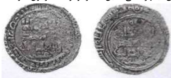
شماره ۱۴: سکه مربوط شهریار بن رستم محل ضرب: ساری، سال نامشخص از جنس دینار (رضایی باغ بیدی، ۱۳۹۳: ۴۷۷).

فخرالدوله و فلک‌الامه بن رکن‌الدوله» و حاشیه پشت سکه: «محمد رسول‌الله ارسله بالهدی و دین الحق لیظهره علی الذین کله و لوکره المشرکون» نوشته شده است. ۷- سکه‌ای مربوط علی بن شهریار از جنس نقره، محل ضرب آن ساری و سال ضرب آن نامشخص به شرح ذیل است. در قسمت وسط سکه «لا اله الا الله، محمد رسول‌الله، علی» حاشیه اول روی سکه «بسم‌الله، ضرب هذا الدرهم بسلویه...» پشت سکه «الله، الراشد بالله، السلطان الاعظم ابوالحارث سنجر» و حاشیه پشت سکه: «محمد رسول‌الله ارسله بالهدی و دین الحق لیظهره علی الذین کله و لوکره المشرکون» نوشته شده است.