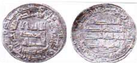
شکل شماره ۶: سکه اموی مربوط طرفداران عبدالله بن معاویه محل ضرب: ماهی سال ضرب ۱۲۷ (ق.ه) از جنس درهم (رضایی باغ بیدی، ۱۳۹۳: ۱۲۴)

الموده فی القربی» (سوره شوری، بخشی از آیه ۲۳) نوشته شده است؛ اما متن پشت سکه همانند سکه های اموی «الله احد الله الصمد لم یلد و لم یولد و لم یکن له کفوا احد» و حاشیه آن «محمد رسول الله ارسله بالهدی و دین الحق لیظهره علی الدین کله و لو کره المشرکون» نوشته شده است. سکه های عبدالله بن معاویه تا سال ۱۳۰ (ق.ه) توسط طرفدارانش ضرب می شده است.