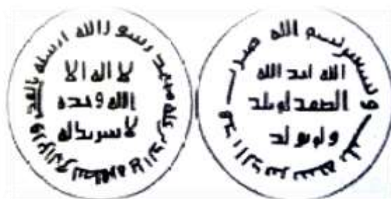
شکل شماره ۴: طرح دینار اموی، ضرب سال ۹۳ (ق.ه) مربوط به ولید بن عبدالملک (رضایی باغ بیدی، ۱۳۹۳: ۹۵)

«عین» و «وَرَق» اشاره کرد که به ترتیب به معنی زر مسکوک و نقره مسکوک بوده است (زمخشری، ۱۸۳۴. م - ستار زاده، ۱۳۸۹: ۴۳۱ - ۵۹۰). واژه ورق در قرآن کریم (۶) نیز به کار رفته است. وزن دینار ابتدا حدود ۴/۲۶-۴/۲۵ گرم (برابر با یک مثقال) و درهم حدود ۲/۸۵ گرم وزن داشت. بر روی سکه‌های اموی، در متن عبارت «لا اله الا الله وحده/ لا شریک له» و در حاشیه جمله «محمد رسول الله ارسله بالهدی و دین الحق لیظهره علی الدین کله و لو کره المشرکون» درج گردیده است. در متن پشت سکه «الله احد الله/ الصمد/ لم یلد/ و لم یولد» در حاشیه آن « بسم الله ضرب هذا لدینار فی سنه ... یا بسم الله ضرب هذا الدینار سنه ... » ضرب گردیده است. یکی از ویژگی‌های مهم سکه‌های اموی آن است که نام خلیفه بر روی آن نوشته نشده و از روی تاریخ ضرب آن می‌توان خلیفه زمان ضرب سکه را شناسایی کرد.