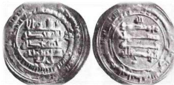
شکل شماره ۹: سکه مربوط عمادالدوله، محل ضرب شیراز، سال ۳۲۲ (ق.ه) از جنس درهم (رضایی باغ بیدی، ۱۳۹۳: ۵۰۸)