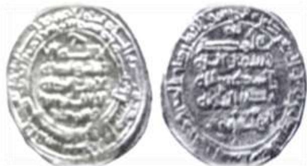
شکل شماره ۸: سکه مربوط بیستون بن وشمگیر، محل ضرب ساری، سال ۳۵۸ (ق.ه) از جنس دینار (رضایی باغ بیدی، ۱۳۹۳: ۴۸۳)