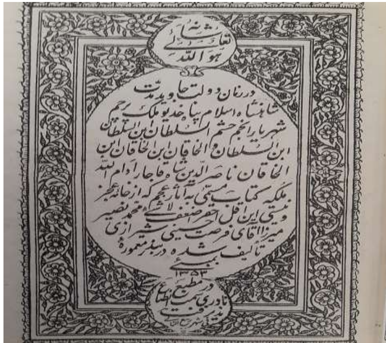
تصویر اول: تصویر صفحه اول کتاب تاریخ عجم، چاپ بمبئی، ۱۳۵۳ ق.