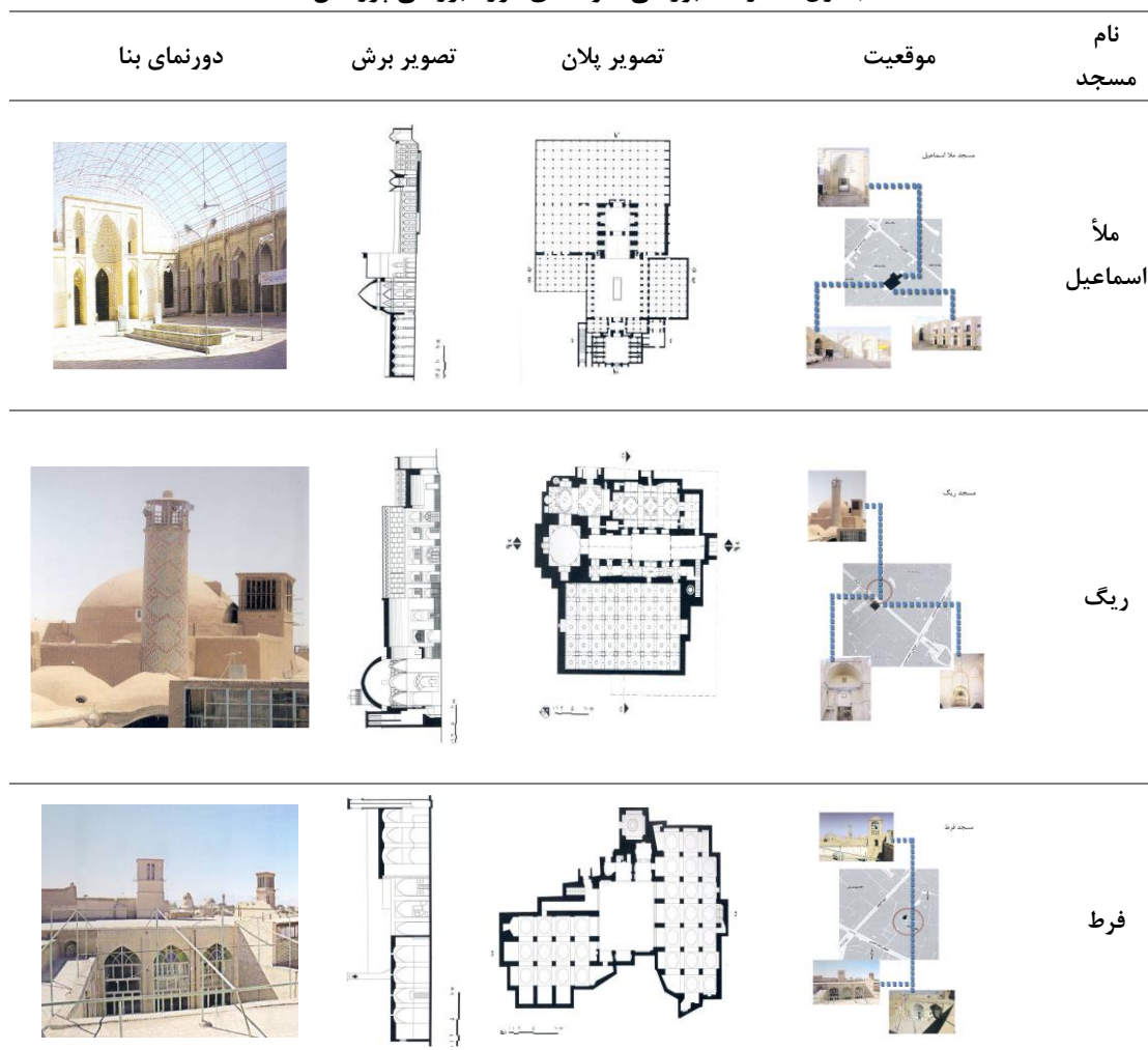
جدول شماره 1: بررسی نمونه‌های مورد بررسی پژوهش.

در جدول (شماره 1) به ارائه نمونه‌های موردی مساجد مورد مطالعه این پژوهش و در جدول (شماره 2) به فضاهای اختصاص یافته به این مساجد پرداخته شده است: