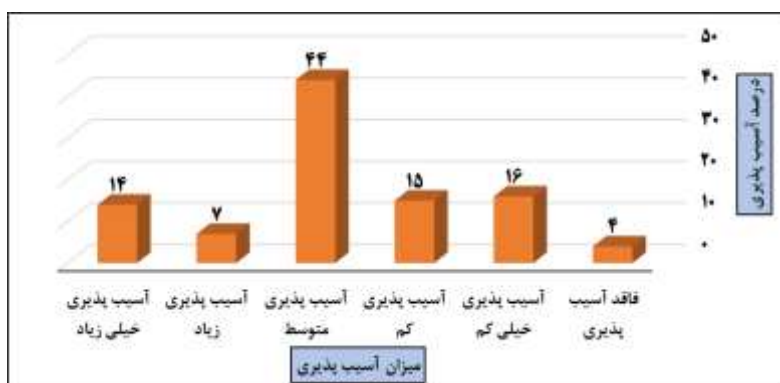
شکل ۲- درصد آسیب پذیری کلی بافت فرسوده مورد مطالعه

با توجه به نتایج حاصل از مطالعه شاخص‌ها، زیر شاخص‌ها و درجه‌بندی آن‌ها بر اساس میزان آسیب پذیری، ۴ درصد بافت فرسوده مورد مطالعه فاقد آسیب پذیری، ۱۶ درصد با آسیب پذیری خیلی کم، ۱۵ درصد با آسیب پذیری کم، ۱۴ درصد با آسیب پذیری متوسط، ۷ درصد با آسیب پذیری زیاد و ۱۴ درصد با آسیب پذیری خیلی زیاد می‌باشد.