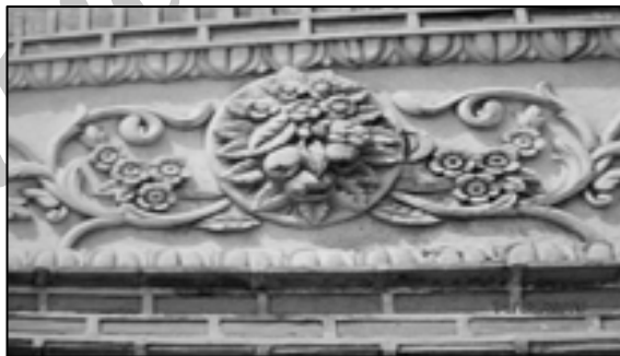
تصویر شماره ۳: گچ‌بری‌های بسیار درشت و برجسته و قالبی غربی که گچ‌بری ریز و دست‌پورده‌ی سنتی را از دوره‌ی قاجار تحت‌الشعاع قرارداد (گوهر خیال، ۱۳۸۸)، ص ۹۹

همچنین، گچ‌بری که روزگار زیادی در کنار آجرکاری با ظرافت و زیبایی به صورت ریز و با تراش روی لایه‌های گچ، انواع نقش‌های گیاهی و هندسی طراحی سنتی را شکل می‌داد، با طرح‌های زمخت و از پیش ساخته و نقش گل‌ها و اشیاء طبیعی که بیش‌تر محصولی صنعتی بود تا دستی، در تزئین بناها به کار رفت (تصویر شماره ۳).