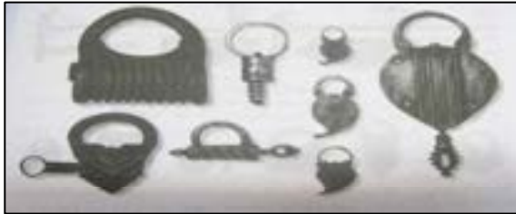
تصویر شماره ۷: قفل‌های فلزی دست‌ساز که با ورود انواع قفل‌های صنعتی به تدریج از زندگی مردم کنار رفت (نیکزاد و صادقیان، ۱۳۸۸: ۲۱۲).

ماشینی مضمحل گردید. یا در سال ۱۲۸۹ ه‍.ق که چراغ‌پایه‌های چدنی در تهران نصب گردید، ۱ مقدمات فراموشی ساخت ابزارهای روشنایی سنتی فراهم آمد (تصاویر شماره ۷ و ۸).