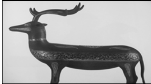
تصویر شماره ۱۱: گوزن فولادین طلاکوب، سده ۱۴ هجری قمری، اصفهان، نشان‌دهنده استمرار فلزکوبی و ریخته‌گری است (ذکاء و سمسار، ۱۳۸۳: ۱۱۸)

در شهر لنگرود دو استادکار، با ناامیدی و بدون شاگرد، اکثراً به سفیدگری ظروف مسی مستعمل و گاه‌گاهی ساخت اشیاء سفارشی، اشتغال دارند. ۱ (تصویر شماره ۱۱).