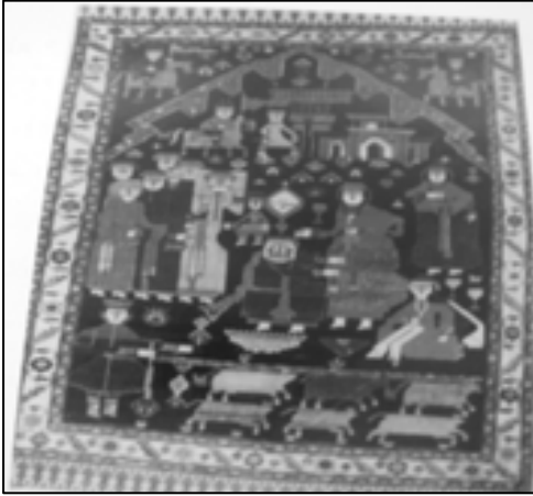
تصویر شماره ۹: قالی ترنج‌دار دست‌بافت باگره فارسی، ۱۳۳۲ هجری قمری، بیرجند (آذریاد و حشمتی رضوی، ۱۳۷۲: شماره‌ی ۴۰).