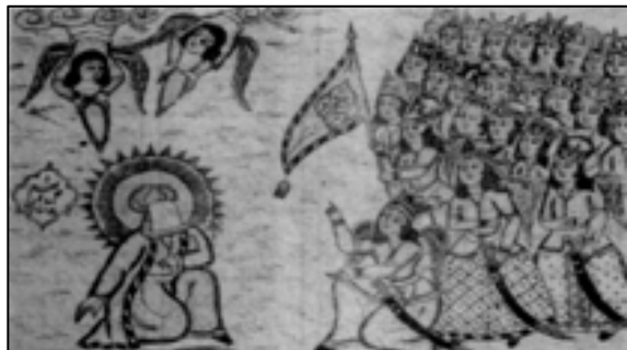
تصویر شماره ۴: فن چاپ سنگی با موضوعات سنتی که روی آثار جدید تجربه شد.