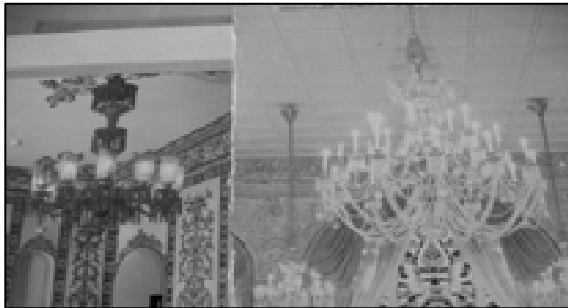
تصویر شماره ۸: انواع لوسترها و لامپ‌های صنعتی که وسایل روشنایی قدیم را از صحنه زندگی کنار زد (نگار ندگان).