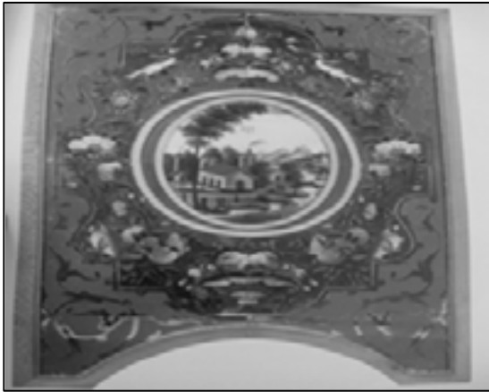
تصویر شماره ۲: نقاشی پشت شیشه نیمه‌ی سده‌ی ۱۳ هجری با دورنمایی، که جای شیشه‌های رنگی و تراش را گرفت (ذکاء و سمسار، ۱۳۸۳: ۵۶).

همچنین، گچ‌بری که روزگار زیادی در کنار آجرکاری با ظرافت و زیبایی به صورت ریز و با تراش روی لایه‌های گچ، انواع نقش‌های گیاهی و هندسی طراحی سنتی را شکل می‌داد، با طرح‌های زمخت و از پیش ساخته و نقش گل‌ها و اشیاء طبیعی که بیش‌تر محصولی صنعتی بود تا دستی، در تزئین بناها به کار رفت (تصویر شماره ۳).