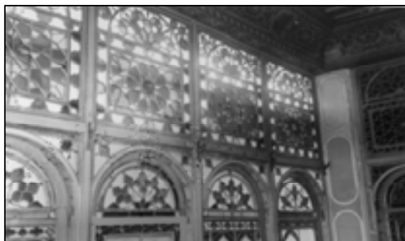
خانه کشمیری- شیراز- قاجار

تصویر شماره ۵: کاربرد قواره های شیشه‌ای (محصول صنعتی) در ارسی‌ها (ساختارهای معماری مدرن) با گره چینی‌های متنوع سنتی