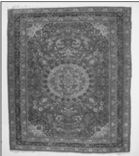
تصویر شماره ۱۰: قالیچه‌ی دست‌بافت شاهسون، از اوایل سده‌ی ۱۴ هجری قمری، با موضوع شیخ صنعان در کنار فرش ماشینی اما کم رونق‌تر (عباسی فرد، ۱۳۸۸: ۴۵).

از دوره‌ی قاجار به بعد، شاهد کم‌رونق شدن بیش‌تر آرایه‌های مرتبط با معماری نیز هستیم. فلزکاری نیز، که دیر زمانی با انواع آرایه‌ها و فنون در خانه و کاشانه و سفر و حضر از آن‌ها استفاده می‌شد، تدریجاً در گوشه‌ی انزوا قرار گرفت، به گونه‌ای که از دوره‌ی قاجار به بعد، بسیاری از مشاغل مربوط به فلزکاری به چند شهر محدود شد. مثلاً در گیلان مس‌گری بر اثر فن‌آوری و انواع ظروف صنعتی، سیر نزولی یافت، به گونه‌ای که در املش یک استادکار، و