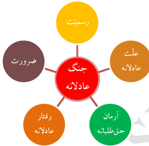
شکل ۲. شاخص‌های جنگ عادلانه

شاخص رسمیت به این مسئله می‌پردازد که مرجع مشروع اعلان جنگ، چه کسی یا چه نهادی است. در مسئله جنگ، جان و مال افراد جامعه در معرض خطر قرار می‌گیرد و بدین جهت تنها شخص یا نهادی، مشروعیت اعلان جنگ را دارد که با پشتوانه مردم به حکومت رسیده باشد. حاکم جامعه این صلاحیت را دارد که تحت شرایطی، این اختیار را به نماینده خویش واگذار کند از این رو نخبگان جامعه که متولی امر حکومت نیستند، بدون اذن حاکم چنین صلاحیتی ندارد.