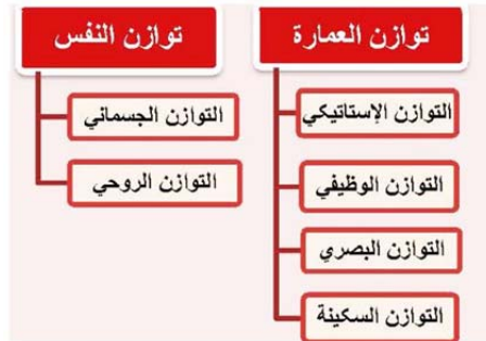
الشكل ٣. مراتب توازن النفس و توازن العمارة؛ المصدر: الباحث.

و يقول: «إنّ الإنسان في نظير الإسلام ليس شقين منفصلين: شقاً أرضياً يعمل و شقاً سماوياً يتعبّد. إنّما العبادة عمل والعمل عبادة. والإنسان بشقيّه شيء واحد، وملاك الأمر في هذه الشؤون كلّها هو «التوازن». وهو صفة تكتسبها النفس من السير علي منهج الله» (التسخيري، ١٩٨١). أمّا التوازن في الإنسان فيتحلّى في المراتب الظاهرة والباطنة، وثمة أحكام كثيرة أيضاً حول إيصال النفس إلى حالة التوازن التي تمّ الإشارة إليها تزامناً مع هذين الوجهين للنفس.