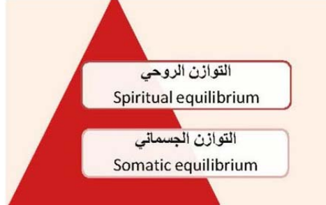
الشكل ٢. مراتب توازن النفس؛ المصدر: الباحث.

و يقول: «إنّ الإنسان في نظير الإسلام ليس شقين منفصلين: شقاً أرضياً يعمل و شقاً سماوياً يتعبّد. إنّما العبادة عمل والعمل عبادة. والإنسان بشقيّه شيء واحد، وملاك الأمر في هذه الشؤون كلّها هو «التوازن». وهو صفة تكتسبها النفس من السير علي منهج الله» (التسخيري، ١٩٨١). أمّا التوازن في الإنسان فيتحلّى في المراتب الظاهرة والباطنة، وثمة أحكام كثيرة أيضاً حول إيصال النفس إلى حالة التوازن التي تمّ الإشارة إليها تزامناً مع هذين الوجهين للنفس.