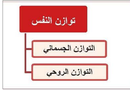
الشكل ١. وجوه مختلف توازن النفس؛ المصدر: الباحث.

الغريون من خلال إغائهم قوّة إدراك الإنسان وكشفه وشهوده، أبعدهوا البعد الرمزي عن العالم، وأنكروا أيّ معنى أو تأويل لما وراء الصّورة، فالعمارة الإسلاميّة من وجهة نظرهم تتلخّص في الصّور الهيكلية فحسب، ولم يتناولوا في توصيفهم للعمارة الإسلاميّة إلا السّقف والقوس والزّخرفة والعناصر المكوّنة دون أيّة مراعاة لمعانيها. أما في النّظرة الحكيمية أو المعرفية حيث يبدو الكشف والشّهود القوّة الإدراكية المهمة فيها، فإنّ الصّورة تقتصر على كونها مظهراً وتجلّي لذلك المعنى، وهي تفقد أهمّيّتها مع مرور الوقت، لذا فإنّهم من خلال التأمّل في هذه الصّور يعملون على حلّ الرّموز وكشف المعاني في هذه العمارة، وحينئذ ستتكشف مقولات كثيرة أمامهم أيضاً عبر هذا التّوع من الرّؤية، ومن أهمّ هذه المقولات الفنان ونوع الفكر والرّؤية والنّظرة التي يحملها تجاه العالم.