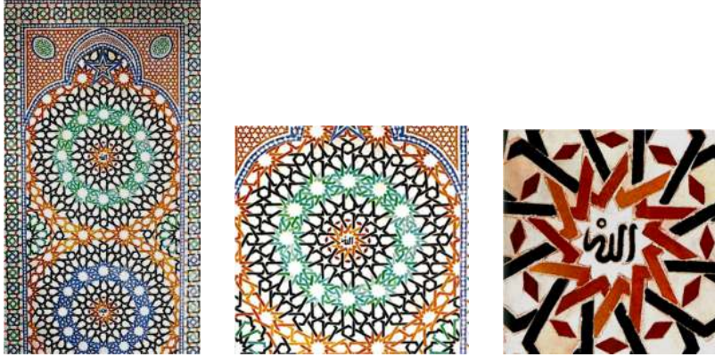
الشكل ٢. الصور و التزيينات

والاستفادة منها. لكن من بين الاختلافات الواضحة التي يمكن الإشارة إليها لتمييز الرؤية التاريخية عن الرؤى الحكيمة والمعرفية، هي الاختلافات في سير حركة هؤلاء المفكرين في طبقات بين الصورة والمعنى.