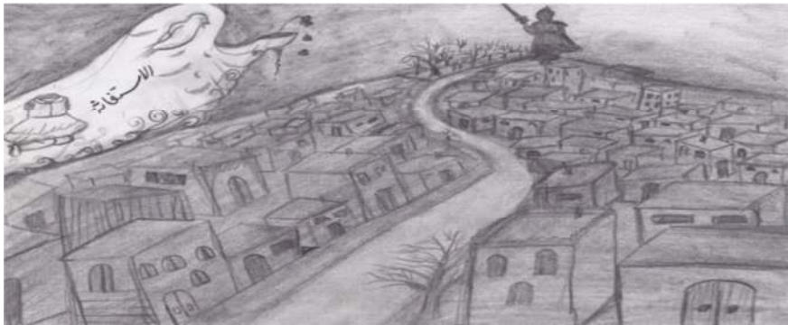
(الرّسم الأوّل) صورة دمشق النائمة والجسد المبدّد

الرأس واليدين وثراباً يحترق، وطيوراً تُودعُ أجنحتها السماء والأشجارَ غيرَ أن أهلَ دمشق كانوا نياماً» (تامر، ١٩٩٤م: ١٤٣). إنَّ الأديب بدأ القصة بوصف دمشق النائمة وأنها بما. وأراد أن يسخر من المكين سخرةً مرّةً إلا أنه أتى باسم المكان فخلط بين المكان والمكين من جهة الجاز اللغوي بعلاقة محليّة، في تركيب «دمشق النائمة» حيث جعل الكاتب مدينة دمشق (المكان) نائمةً بدلاً عن الناس النائمين (المكين). والقرينة في ذلك تتجلى في عبارة «أنَّ أهلَ دمشق كانوا نياماً» التي تدلّ على نسبة التّوم إلى الناس، حقيقةً. بينما عبارة «كانوا نياماً» تجري على الكناية وتقصد أنّهم كانوا غافلين. كذلك توجد استعارة مصرّحة تبعيّة في عبارة «طيوراً تُودعُ أجنحتها السماء» حيث يقصد الكاتب بإيداع الأجنحة جراحة الأجنحة.