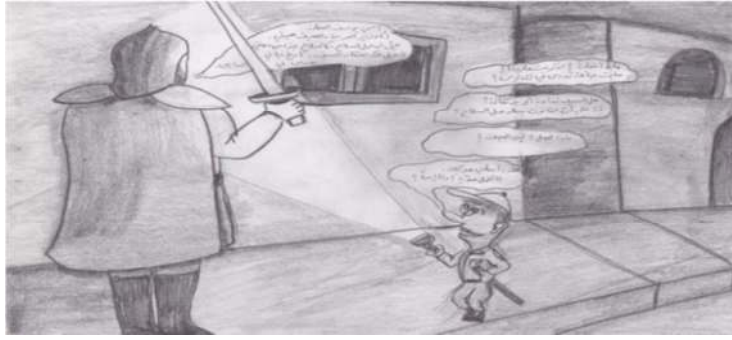
(الرَّسْمُ الثَّانِي) صورة المتكفِّف الجاهل والسَّلاح بغير مفعول

مَرَّةً واحدةً بين أسماءِ الوزراءِ. قالَ يُوسفُ العَظْمَةُ بِدهشَةٍ: ماذا تقولُ؟! كيفَ لم تسمعَ باسمي؟ تاريخُ حياتي يُدرِّسُ في المدارسِ. قالَ الحارسُ: ما شاءَ اللهُ! ما شاءَ اللهُ! وماذا فعلتَ حتَّى صارتَ حياتُكَ تُدرِّسُ في المدارسِ كالجغرافيا والحسابِ؟ اخترعتَ صاروخاً؟ قالَ يُوسفُ العَظْمَةُ: أنا الَّذي حاربَ الجيشَ الفرنسيَّ في ميسلونَ لمنعه من الوصولِ إلى دِمَشقَ واحتلالها. وهناك في ميسلونَ قُتلْتُ» (المصدر نفسه: ١٤٥).