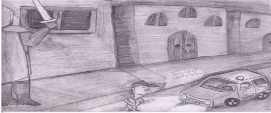
(الرّسم الثالث) صورة الوزير الرّائف

وقال للحارس: ما الخبر؟// قال الحارس: الأخ يتحوّل وهو يحمل سيفاً ويدّعي أنّه وزير.// قال الشرطي: سنأخذه معنا ونريحك منه.// ثمّ أضاف موجّهاً الكلام إلى يوسف العظمة: هل يتفضّل السيّد الوزير بالركوب في سيّارتنا؟ (تامر، ١٩٩٤م: ١٤٦).