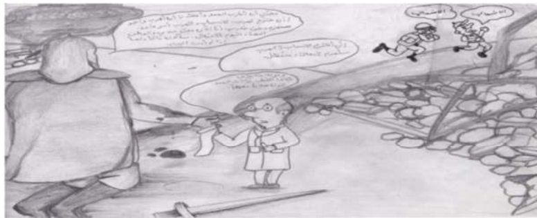
(الرّسم الخامس) صورة رفض موت الخزي

وَقُوْفُكَ هُنَا يُعْرَضُ حَيَاتُكَ لِلخَطَرِ. // مُهْمَتِي الْيَوْمَ أَنْ أَحَارِبَ الْعَدُوَّ وَأُهْلِكَ لَا أَنْ أَهْرَبَ وَأُجَوَّ. // وَلَكِنْ قُوَاتُ الْعَدُوِّ تَقُوْفُنَا سِلَاحاً وَعَدَداً؟ // مَاذَا تَقْتَرِحُ؟ // الْاِنْسِحَابُ يُحَافِظُ عَلَى أَرْوَاحِ رِجَالِنَا. // إِذَنْ أَنْتَ تَقْتَرِحُ الْهَرَبَ؟! // إِنِّي أَقْتَرِحُ الْاِنْسِحَابَ لَا الْهَرَبَ. // الْاِنْسِحَابُ وَالْهَرَبُ أَمْرٌ وَاحِدٌ لِأَنَّ الْوَطْنَ فِي حَالِ الْاِنْسِحَابِ وَالْهَرَبِ سَيُتْرَكُ لِلْعَدُوِّ لِيَسْتَوْلِيَ عَلَيْهِ (تامر، ١٩٩٤م: ١٤٧).