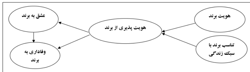
نمودار ۱: مدل مفهومی پژوهش