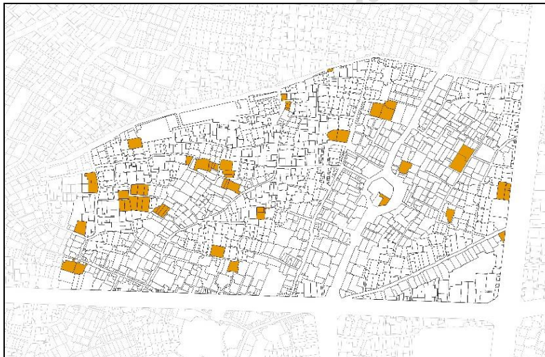
شکل ۳: بناهای تاریخی و باارزش محله علی‌قلی آقا

در حال حاضر ساختار محله تقریباً به همان قوت باقی است و کلیه عناصر کالبدی تعریف‌کننده یک محله با مرکز محله مشخص شامل بازارچه، مسجد و حمام (هرچند با تغییرات کالبدی و بعضاً حذف بخش‌هایی از این عناصر کالبدی) در آن وجود دارد. اما باتوجه به برخی تغییرات و خیابان‌کشی‌ها و نیز، از بین رفتن برخی عملکردها در طول زمان (مانند استفاده از حمام‌های عمومی و...)، از جنبه عملکردی، تغییراتی در ساختار محله ایجاد شده که در حال حاضر بیشتر جنبه گردشگری و گذران اوقات فراغت و فرهنگی به خود گرفته است.