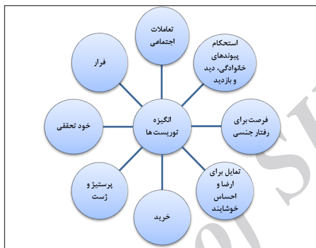
شکل ۱: عوامل روان‌شناختی گردشگران برای مسافرت (کلانتری و فرهادی، ۱۳۸۷: ۱۷۱)

تحت عنوان طبیعت گردان موردی از آن‌ها یاد می‌کند، تجربه سبک زندگی جدید و متفاوت مهم‌ترین انگیزه گردشگران است. همچنین کشف مناطق و کسب آگاهی، افزایش دانش و ملاقات با مردم جدید را از دیگر انگیزه‌های مهم آنان برمی‌شمرد (سید موسوی، ۱۳۹۲: ۱۲۴). برن ۱ انگیزه گردشگران نوین را ناشی از شرایط پست‌مدرن (پسانوگرا) می‌داند و سایر عوامل را ذیل مؤلفه‌های روان‌شناختی جای داده است. وی به نقل از ریان عوامل روان‌شناختی گردشگران را در شکل ۱ نمایش می‌دهد.