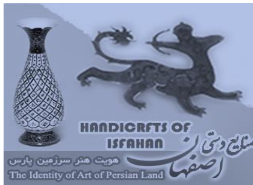
شکل ۳: نشان صنایع دستی اصفهان؛ منبع: نظر کارشناسان

در نهایت، با در نظر گرفتن موارد فوق، نشان زیر برای صنایع دستی اصفهان پیشنهاد شده است.