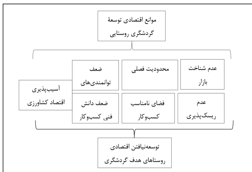
شکل ۱: مدل مفهومی تحقیق

یکدیگر سبب می شود که ساکنان بومی روستا از فواید اقتصادی گردشگری روستایی بی نصیب بمانند. هدف از این پژوهش، شناخت و واکاوی موانع اقتصادی توسعه گردشگری روستاهای هدف استان زنجان است تا از این رهیافت به منظور رفع معضلات و مشکلات روستاهای هدف استان گام مثبت برداشته شود. نتایج تحقیق نشان می دهد که روستاهای هدف گردشگری استان زنجان در مسیر توسعه گردشگری روستایی، با موانعی روبه رو هستند که در دو مقوله با عنوان مقوله اقتصادی (۱). آسیب پذیری اقتصاد کشاورزی؛ ۲. محدودیت فصول گردشگری) و مقوله فضای کسب و کار نامناسب (ضعف توانمندی های فردی، فضای نامناسب اقتصادی، ضعف توانایی فردی، عدم ریسک پذیری، عدم شناخت بازار و ضعف دانش فنی کسب و کار) کدگذاری شد که هر یک از این دو مقوله، شامل زیرشاخص های خاص خود است.