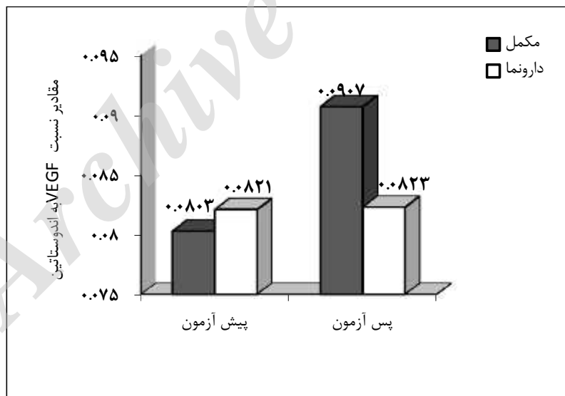
شکل ۳- تغییرات نسبت VEGF به اندوستاتین گروه‌ها طی مراحل پیش و پس آزمون