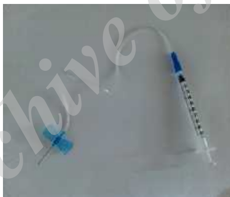
شکل ۱- سرنگ پروانه‌ای ۲۲G متصل به سرنگ انسولینی

یک) و به‌عنوان ابزار جمع‌آوری مایع مغزی نخاعی استفاده گردید. جهت جلوگیری از ورود خون به مایع مغزی نخاعی، نوک سرنگ به اندازه سه تا چهار میلی‌متر وارد سیسترنای مگنا گردید و عملیات کشیدن مایع توسط شخص دوم به آهستگی و در مدت کمتر از ۳۰ ثانیه تکمیل شد. همچنین، رنگ مایع به‌دقت کنترل می‌گردید تا آلوده به خون نباشد. سپس، مایع مغزی نخاعی جمع‌آوری شده (۴۰ تا ۹۰ لاند) در تیوپ‌های ۰/۲ تخلیه گشت و در دمای ۸۰- درجه سانتی‌گراد نگهداری شد (۱۶، ۱۵). بلافاصله پس از جمع‌آوری مایع مغزی نخاعی، نمونه خون به‌صورت مستقیم از قلب حیوان جمع‌آوری گردید، جداسازی سرم انجام گرفت و پلاسما با سانتریفیوژ در دمای چهار درجه سانتی‌گراد به مدت ۱۵ دقیقه و دور ۳۰۰۰g انجام گرفت. گروه تمرین + CGRP(8-37)، ۱۰ دقیقه قبل از انجام تمرین استقامتی، تزریق درون‌صفاقی (CGRP(8-37) به مقدار (10 µg/kg) را دریافت نمودند (۱۷). این تزریق به‌منظور منع گیرندهای CGRP و خنثی کردن عمل CGRP در بافت‌ها انجام شد. سپس، این گروه همانند گروه تمرینی محض، ادامه کار را تجربه نمود و مشمول جمع‌آوری مایع مغزی نخاعی، سرم و پلاسما پس از انجام تمرین شد.