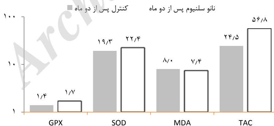
شکل ۲- تأثیر ۱۴ روز بارگیری مکمل پس از دو ماه بین دو گروه نانوسلنیوم با گروه کنترل